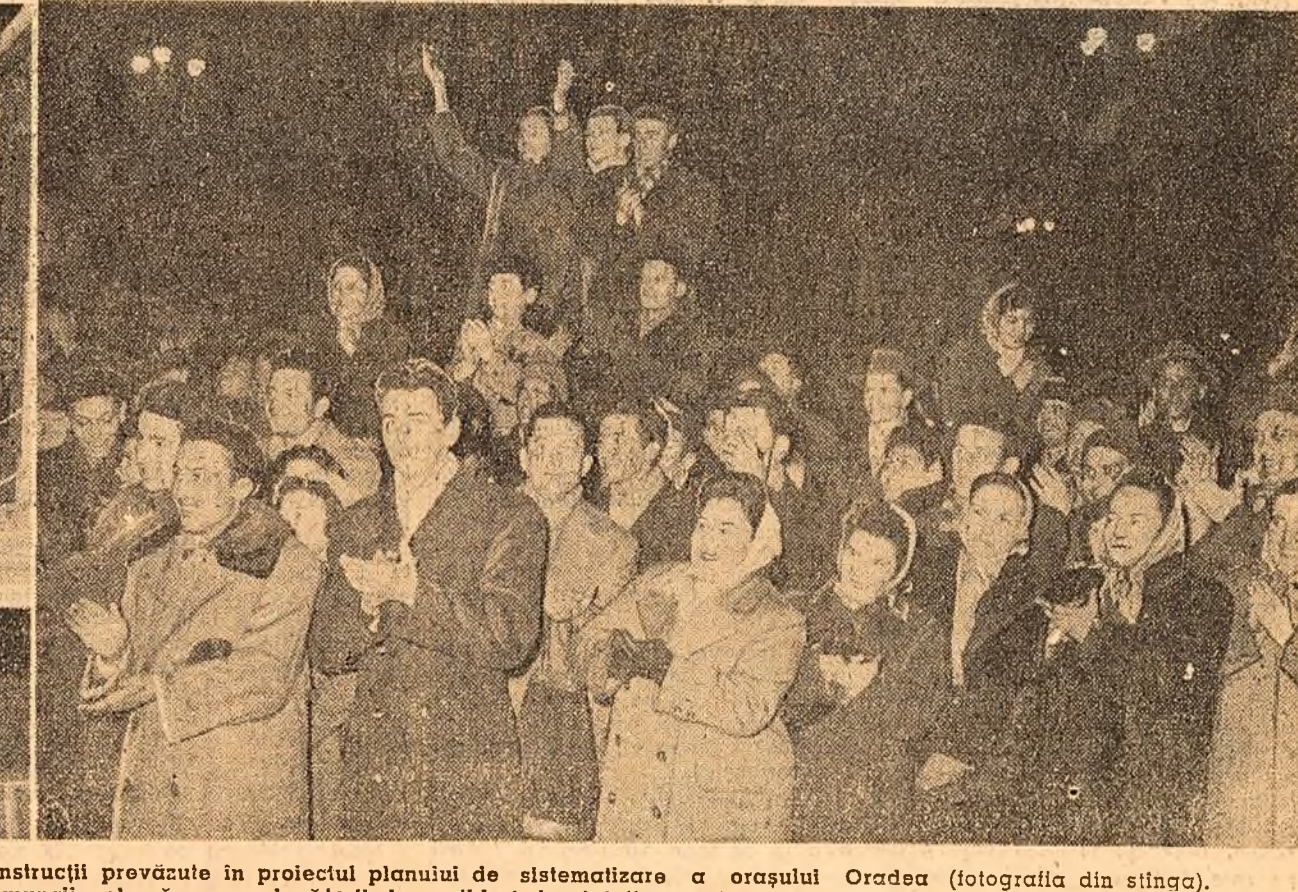
Pe străzile orașului Oradea o amenii muncii aclamă pe conducătorii de partid și de stat (fotografia din dreapta).