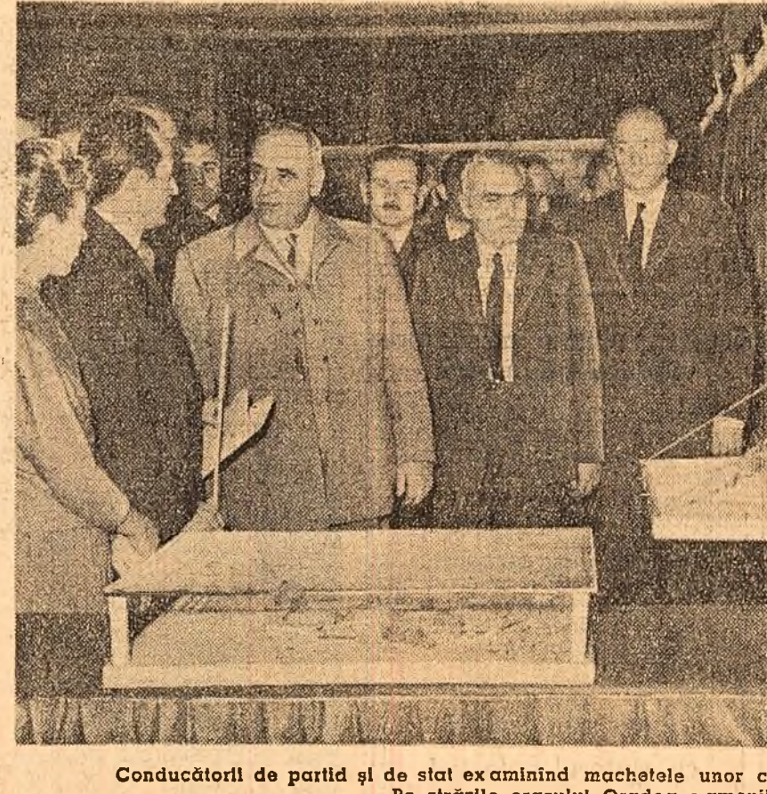
Conducătorii de partid și de stat examinînd machedele unor construcții prevăzute în proiectul planului de sistematizare a orașului Oradea (fotografia din stînga). Pe străzile orașului Oradea o amenii muncii aclamă pe conducătorii de partid și de stat (fotografia din dreapta).