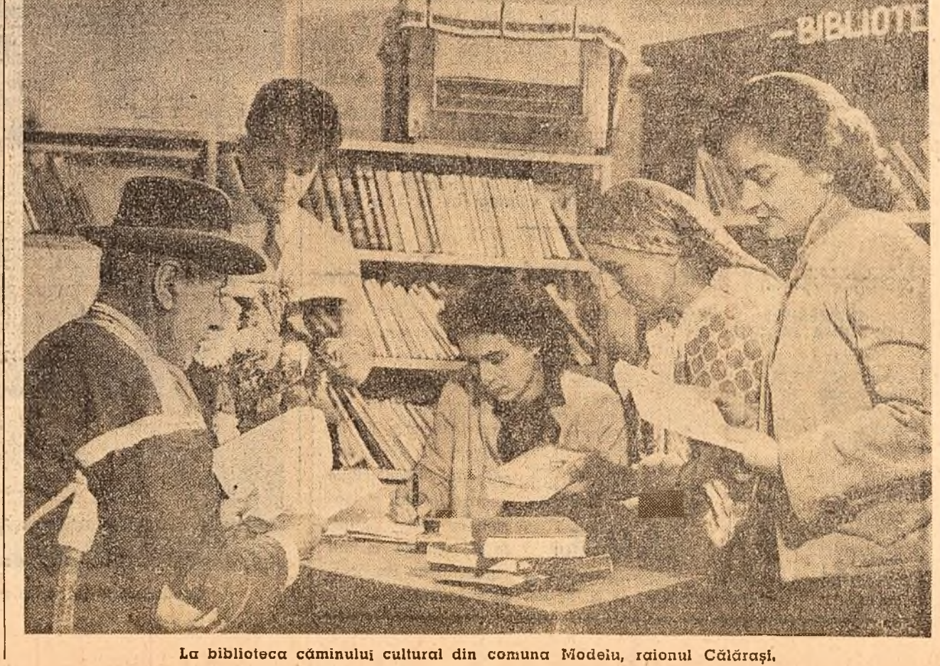
La biblioteca cîmînului cultural din comuna Molești, raionul Călmățui.

Pagină întocmită cu ajutorul redacției ziarului „Steagul Roșu”