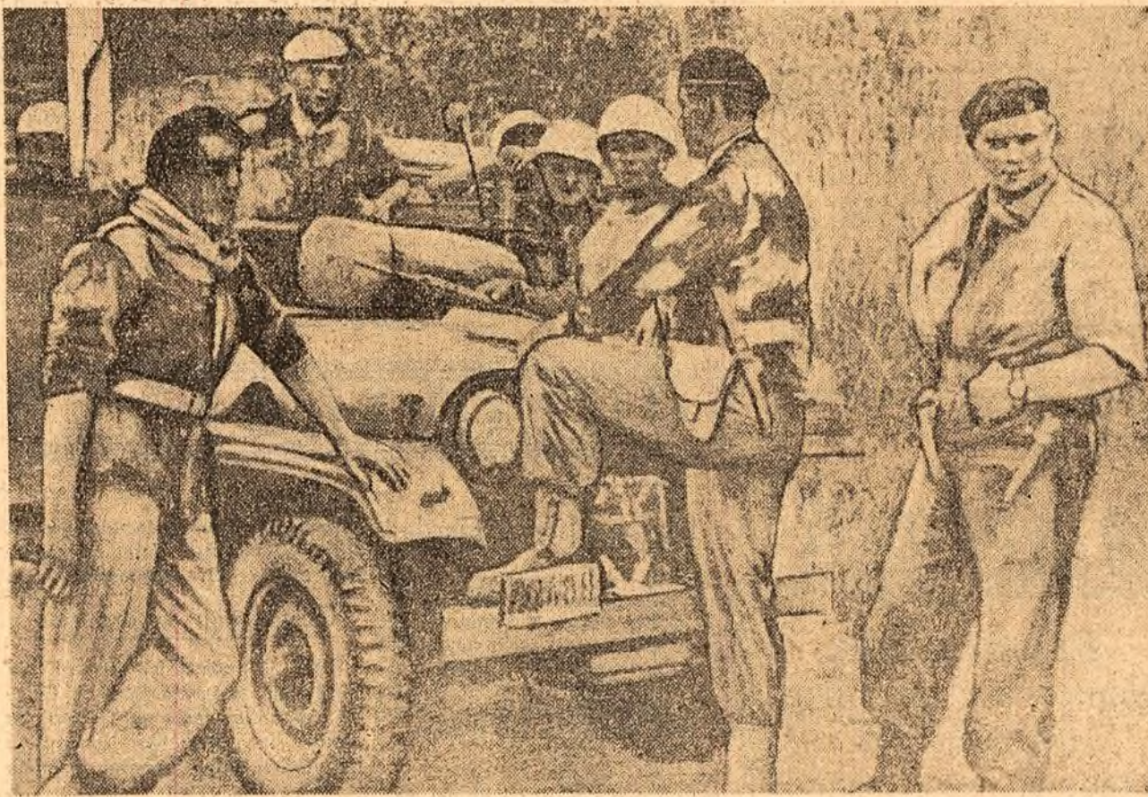
Aspecte de la demonstrația din fața legăției Belgiei la București

Participanții la conferință recomandă un ansamblu de măsuri pentru prevenirea războiului civil în Congo.