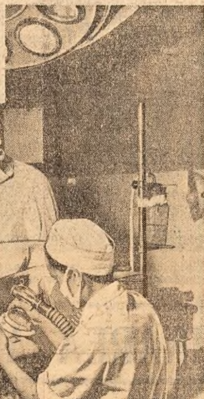
O intervenție chirurgicală la spitalul din Vadul Lat, raionul Videle.

Odată cu dezvoltarea șantierului, construcții navale, învățînd din bogata experiență a constructorilor sovietici, au trecut la executarea unor noi tipuri de vase. În anul 1950 s-a construit primul sloop de 1.000 tone, crăvia i-au urmat navele pescărești metalice. Din vara anului 1957 încep construcțiile navale sudate de mare tonaj, primele motonave de 2.000 tone. Cu doi ani mai tîrziu s-au construit în șantierul nostru șase pasagere maritime, care fac curse pe litoralul Mării Negre, iar în 1960 vasul pasager fluvial „Otlenița” de 350 locuri. El este dotat cu cele mai moderne instalații navale, interioarele fiind în întregime executate din mase plastice. Tot în anul 1960 s-a livrat primul caam de 1.000 tone proiectat în șantier. S-au dezvoltat șantierul, au crescut și oamenii. S-a extins mult sudura automată. Numărul lucrătorilor care minuesc cu pricepere aparatele de sudat automat crește continuu. Recent, 30 de sudori s-au calificat la cursurile organizate la șantier. Dar schimbările petrecute pe șantierul nostru nu se vor opri aici. Vom trece în curînd la construcția de nave cu tonaj mai mare de 2.000 de tone.