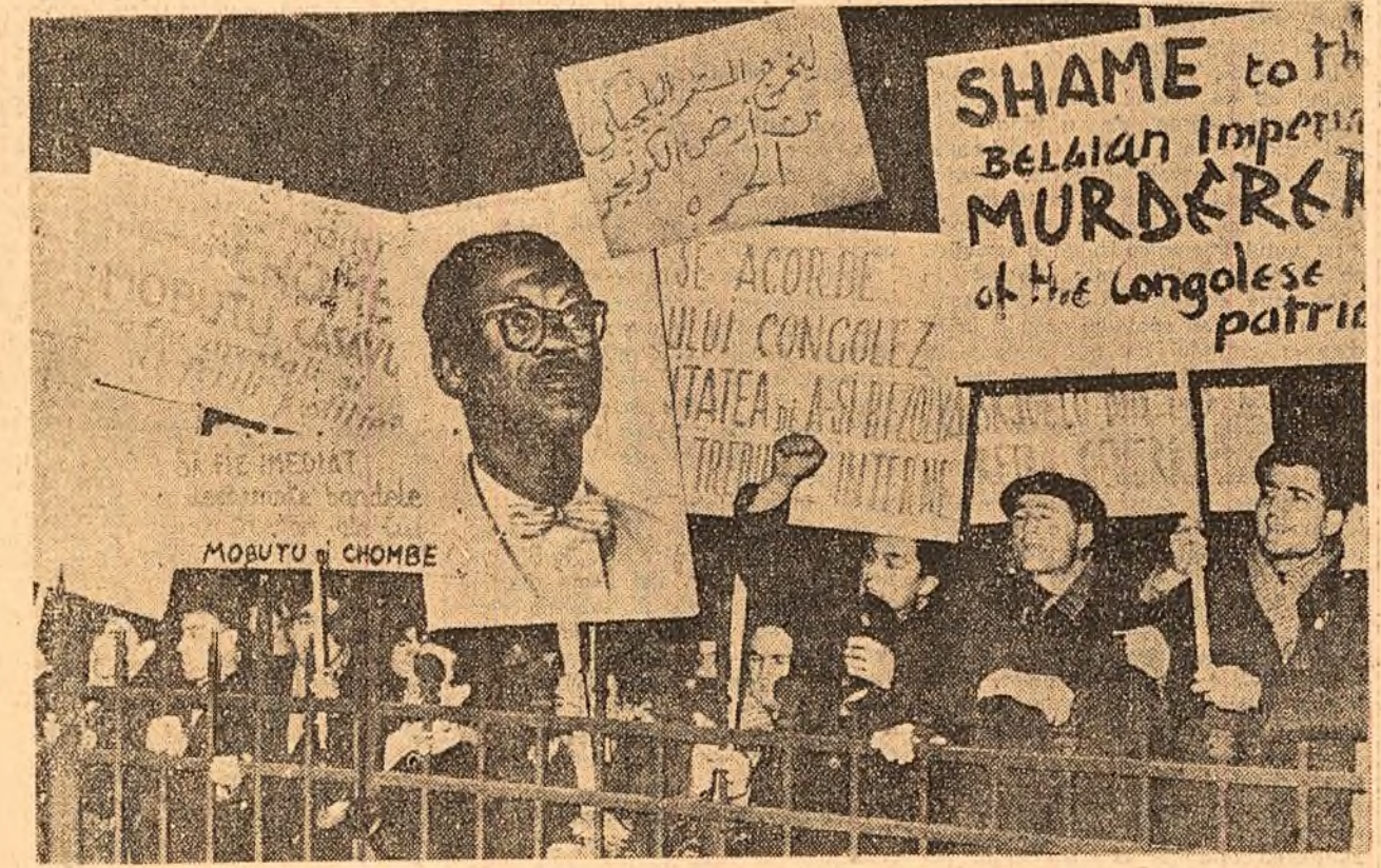
Aspecte de la demonstrația din fața legăției Belgiei la București

GENEVA 23 (Agerpres). — Comisia economică O.N.U. pentru Europa a dat publicității un raport în care se arată că în 1960 producția de cărbune din aproape toate țările vest-europene a scăzut în raport cu anul precedent. În Franța producția de cărbune a scăzut cu 1,6 milioane tone. În același timp raportul subliniază creșterea producției de cărbune în toate țările socialiste.