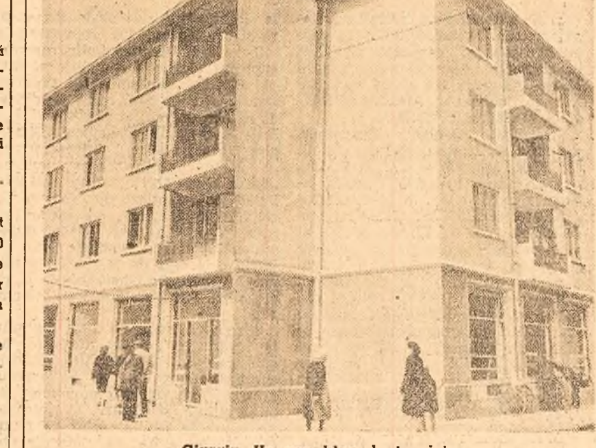
Giurgiu. Un nou bloc de locuințe.

În regiune destăoară o bogată activitate 14 case racionale de cultură, 774 cămine culturale, 17 cluburi sindicale, peste 500 colțuri roșii, 15 biblioteci racionale și peste 1.000 biblioteci satești, comunale și sindicale. Numărul cinematografelelor a crescut la 231. Rețeaua de radiolocale s-a lărgit necontenit. În prezent există 150 centre de radiolocale cu aproape 80.000 abonați. Numărul posesorilor de aparate de radio a ajuns în 1960 la 65.000. Bibliotecile publice au peste 3.200.000 volume, iar numărul cititorilor a crescut la peste 325.000. În satele regiunii activează un număr de peste 50.000 artiști amatori.