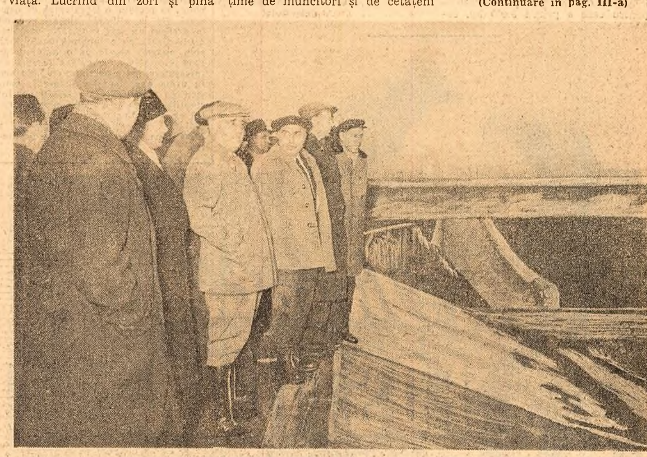
În timpul vizitei la hidrocentrala de la Aștileu.

Barasău, Paltin, Răstolita și Lunca Bradului au fost trimise broșuri, pliante și alte materiale electorale. Numeroase brigăzi de a gălăție și cecipo culturile vor participa peste 300 de cetățeni. La Casa alegătorului 13 Septembrie a avut loc un simpozion cu tema: „Stiința și tehnica în anul regimului de democrație populară”.