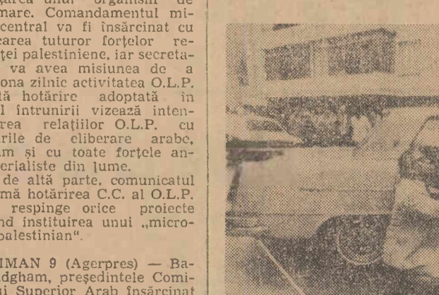
Politia braziliană examinind automobilul folosit pentru blocarea arterei de circulație, în timpul răpîrii diplomatului elvețian