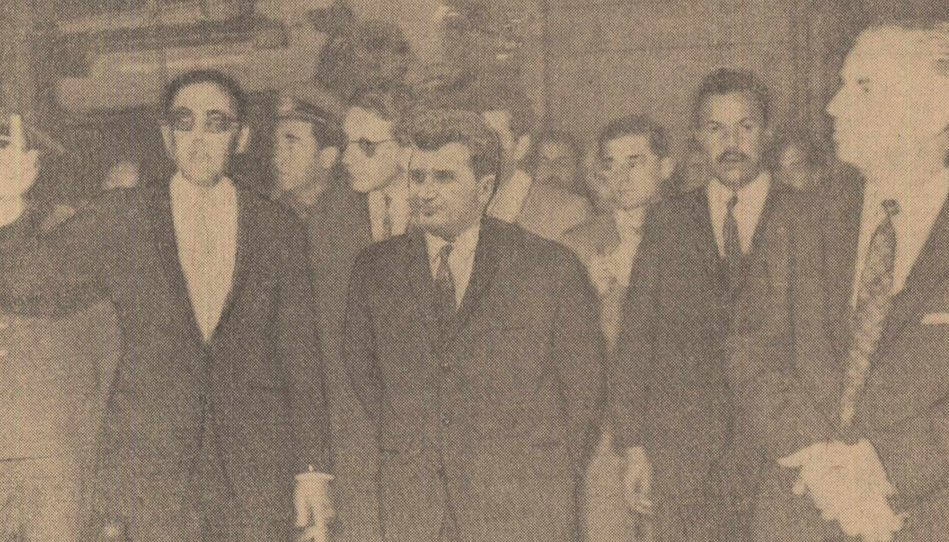
Cu prilejul vizitei la Somalia, întreprindere marocană ce asamblează autovehicule de diverse mărci. (În pagina a 3-a: Reportajul cu vizita președintelui Nicolae Ceașescu în provincia Kenitra și orașul Casablanca)