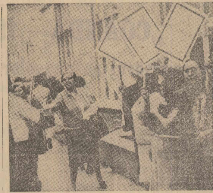
Aspect de la o manifestație a femeilor din San José — una din acțiunile revendicative organizate, în ultimul timp, de oamenii muncii din Costa Rica, în sprijinul îmbunătățirii condițiilor de muncă și de trai

Specialiștii sovietici au furnizat joi noi amănunți în legătură cu „Lunohod-1”. Ele se referă la un aparat cibernetic, dotat cu cinci sisteme conduse prin impulsuri date de pe Terra, de un echipaj format din cinci oameni: un comandant de bord, un pilot, un inginer de bord, un navigator și un operator-radio. Fiecare dintre aceștia duce „ordine” automobilului lunar potrivit specifica-