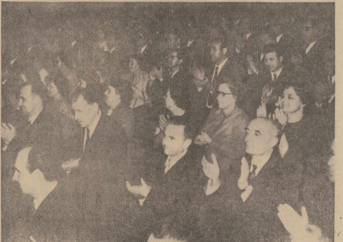
© parte din participanții la mitingul din Sala Congreselor

În numele, Republicii Populare Bulgaria, TODOR JIVKOV GHEORGHI TRAIKOV