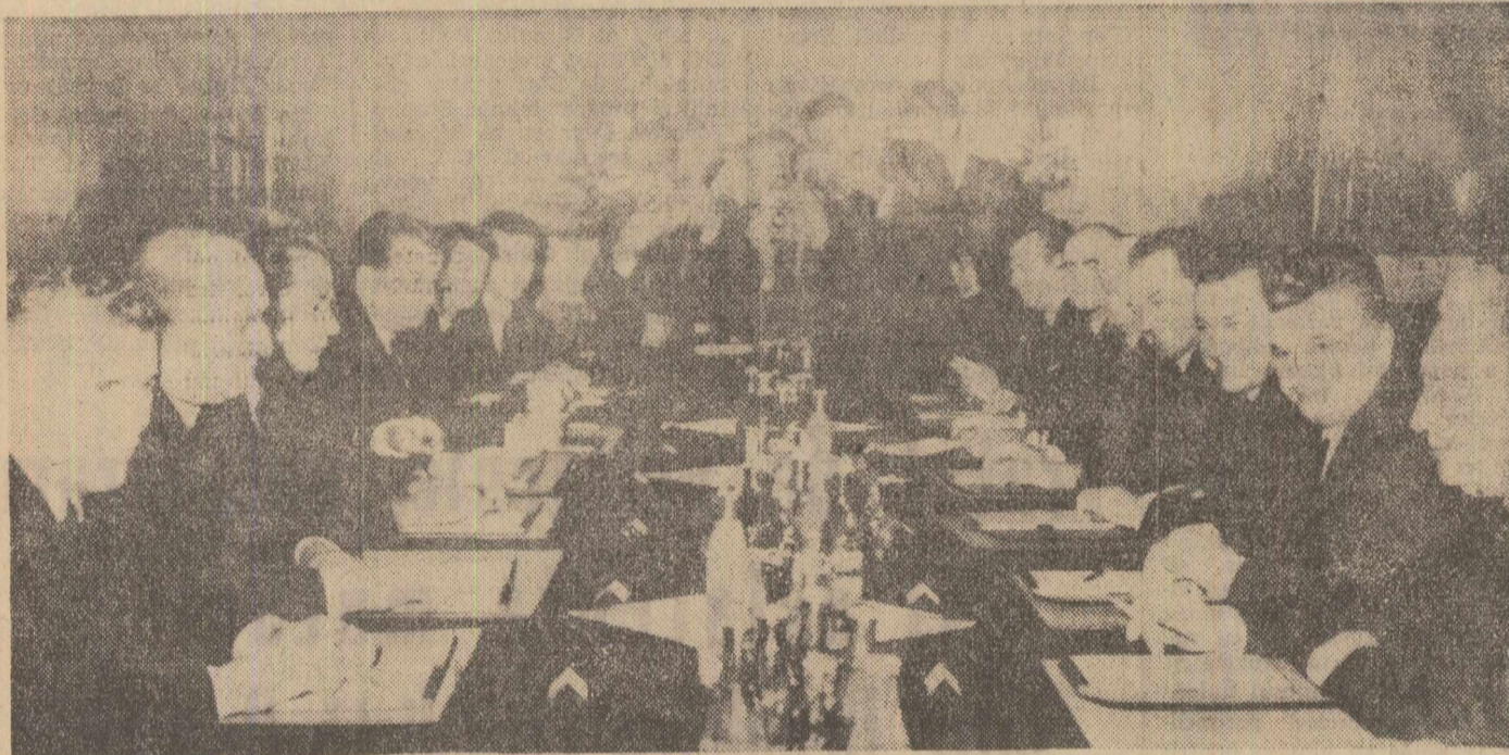
Aspect din timpul convorbirilor oficiale