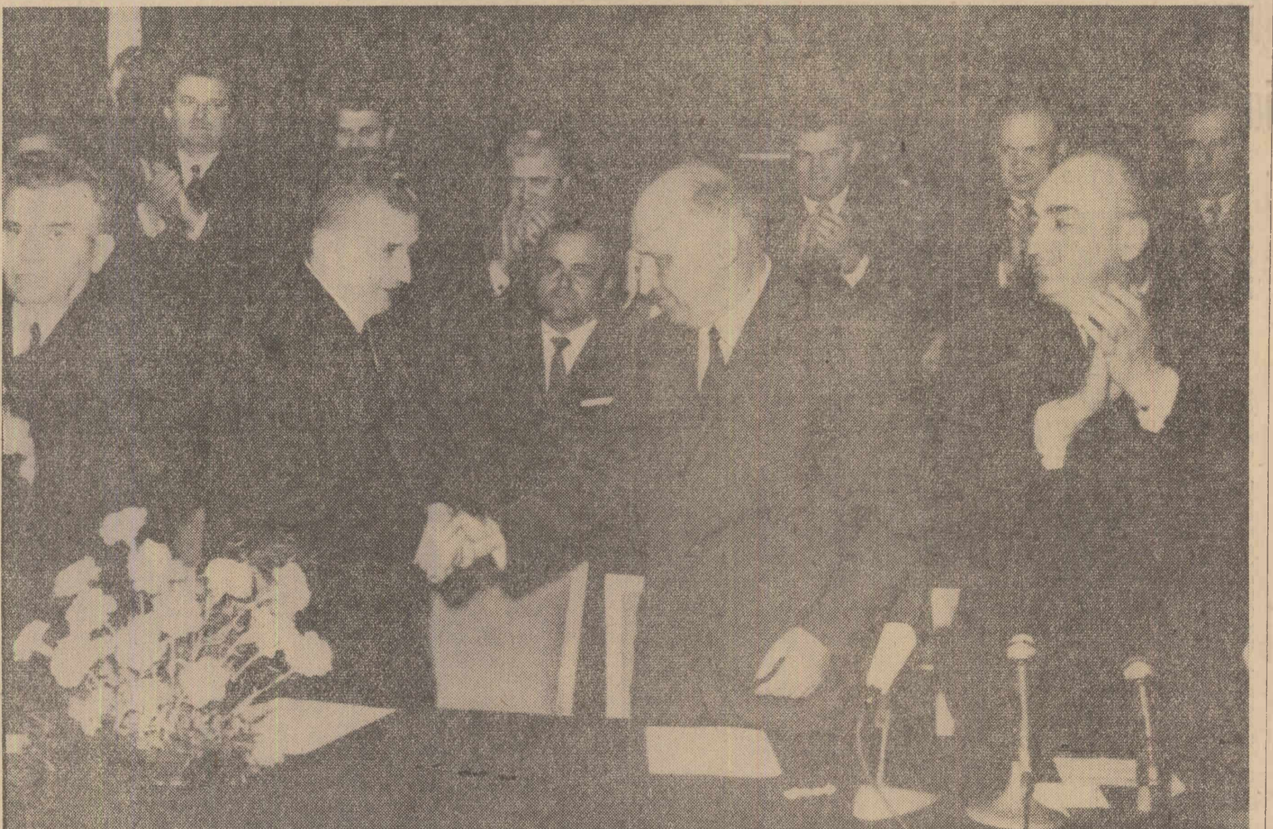
Un moment din timpul mitingului din sala Congreselor din Sofia