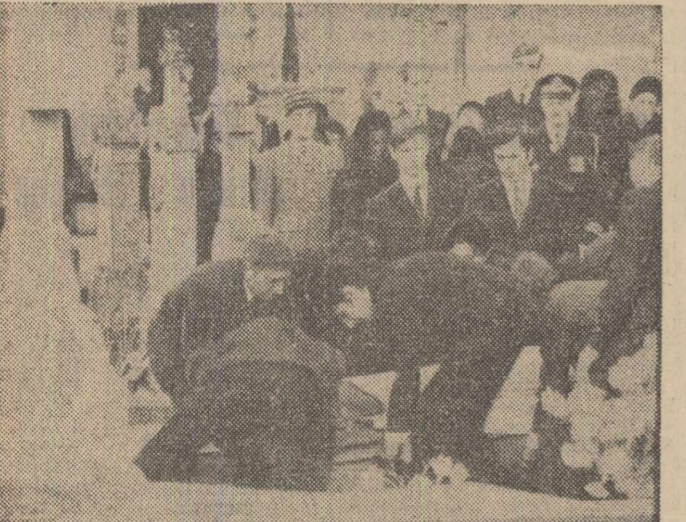
La cimitirul din Colombe-les-Deux-Eglises, în timpul ceremoniei funerare. Sicriul cu corpul neînsușit al generalului de Gaulle este coborît în criptă