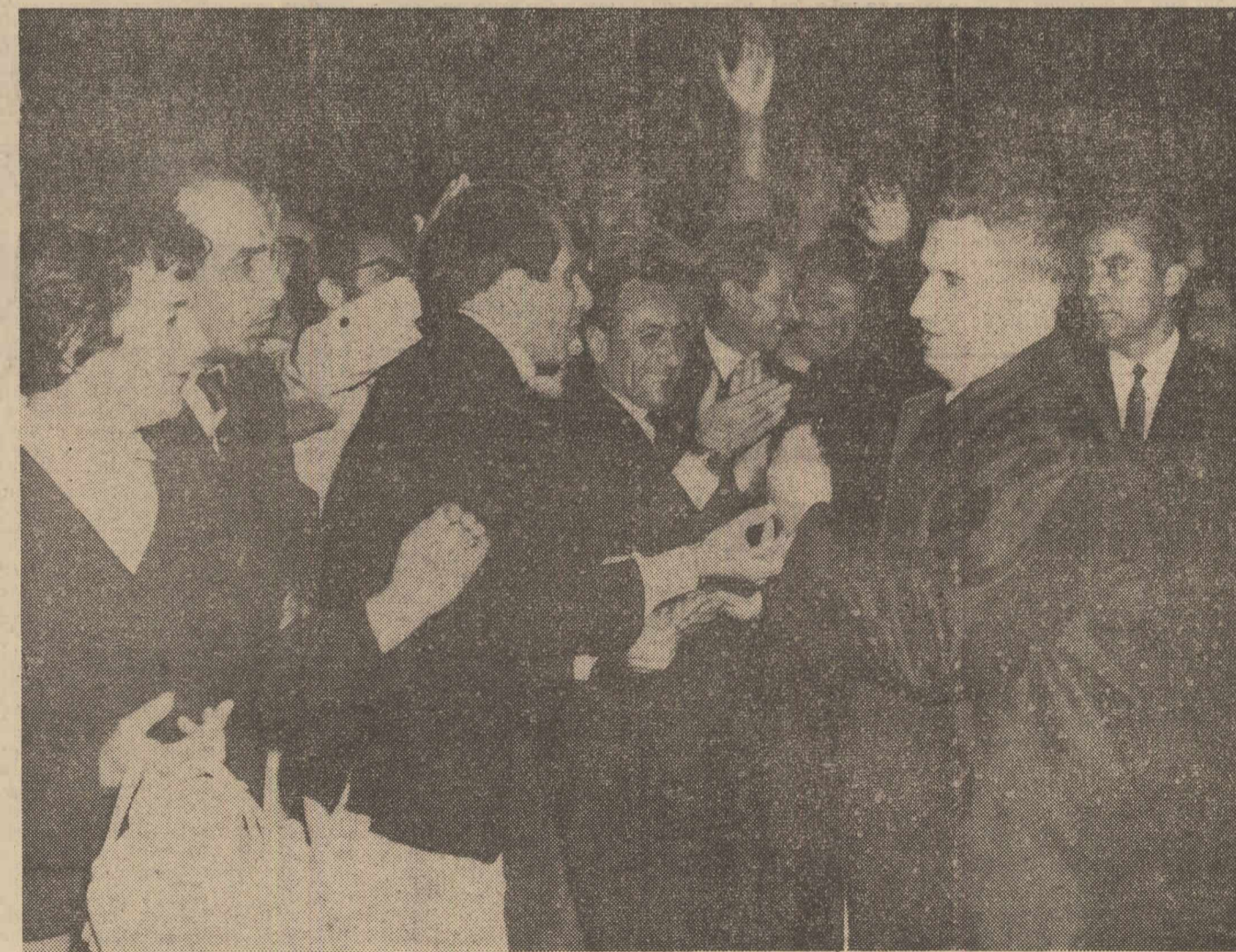
Tovarășul Nicolae Ceaușescu întâmpinat cu viu și puternic entuziasm de locuitorii Capitalei la sosirea pe aeroportul Băneasa