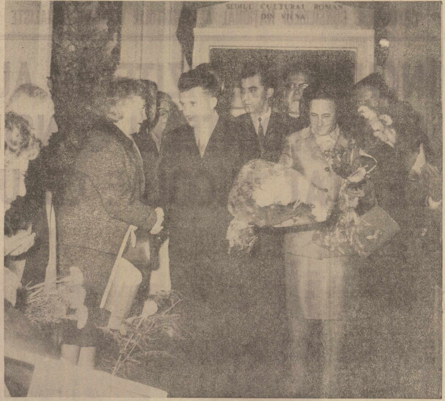
În vizită la colonia română din Viena

genției, punîndu-l la dispoziție experți reputeți și oferind unor cercetători din alte țări posibilitatea să se specializeze în laboratoarele sale. Pe baza înțelegerilor cu forurile științifice românești, care se ocupă de problemele folosirii energiei atomice în scopuri pașnice, a continuat dr. S. Eklund, Agenția va trimite, la rîndul ei, la București experți, în special în domeniul aplicării în oncologie și chirurgie a cercetărilor nucleare. Relevînd contribuția prestigioasă a experților români la activitatea organizației el a menționat că România a făcut de două ori parte din Consiliul de conducere al A.I.E.A. Președintele Nicolae Ceaușescu și soția sa au semnat în cartea de onoare a Agenției Internaționale, după care oaspeții au fost invitați în marea sală a Conferinței generale. Participanții la sesiunea anuală fac o primire cordială șefului statului român, aplaudînd îndelung, în picioare. De la tribuna conferinței, tovarășul Nicolae Ceaușescu a rostit o cuvîntare urmîrită cu un deosebit interes de întreaga asistență.