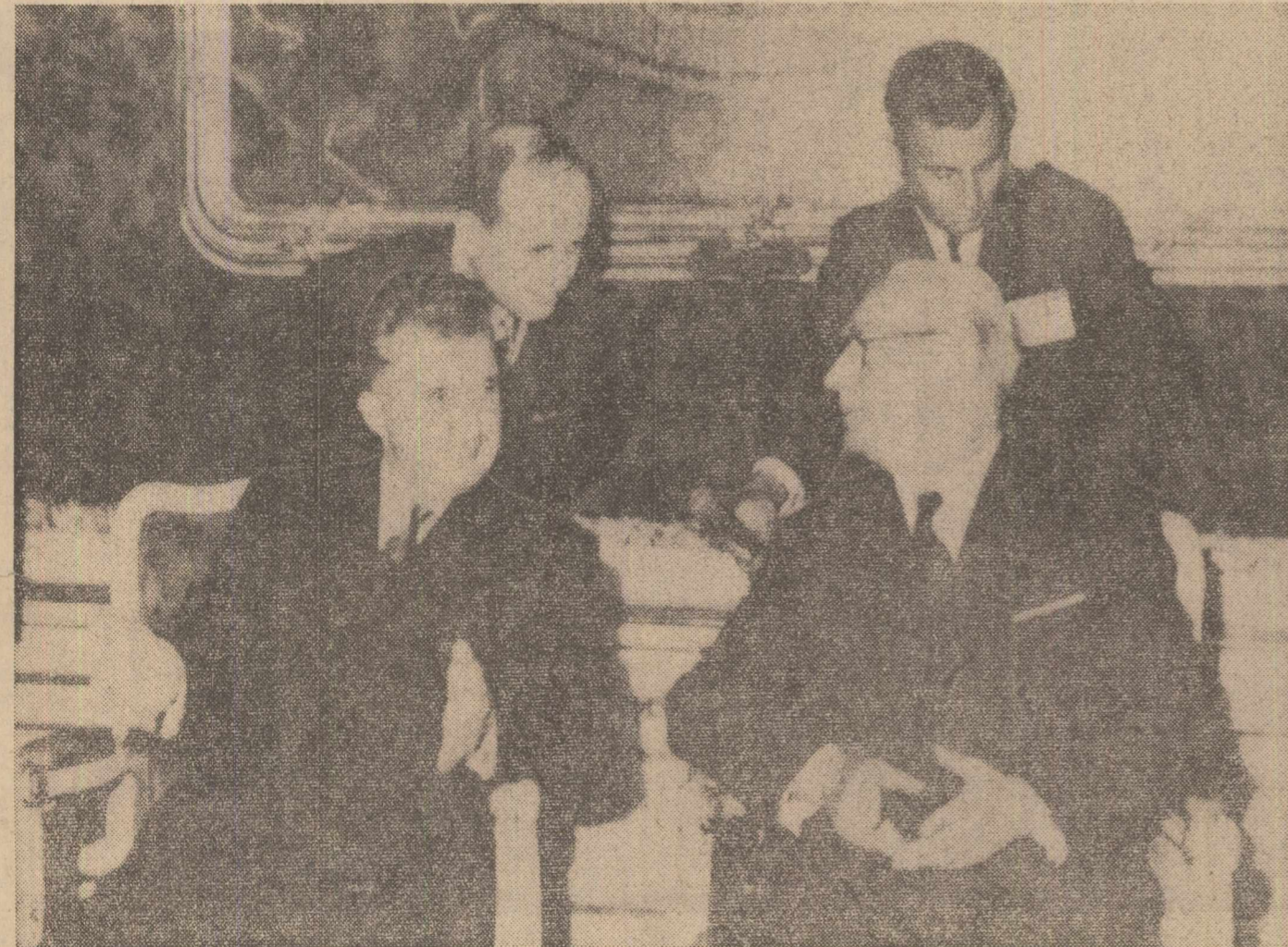
În timpul vizitei protocolare

Survoldind teritoriul Republicii Socialiste România, în drum spre Norvegia, Todor Jivkov, prim-secretar al C.C. al P.C. Bulgar, președintele Consiliului de Miniștri al R. P. Bulgaria, a transmis o telegramă tovarășilor Nicolae Ceaușescu, secretar general al P.C.R., președintele Consiliului de Stat, și Ion Gheorghe Maurer, președintele Consiliului de Miniștri al Republicii Socialiste România. „Vă transmit dumneavoastră și întregului popor român cele mai cordiale urări de succes în construirea socialismului. Imi exprim încrederea în dezvoltarea continuă și întărirea prieteniei între cele două țări ale noastre”, se spune în telegramă.