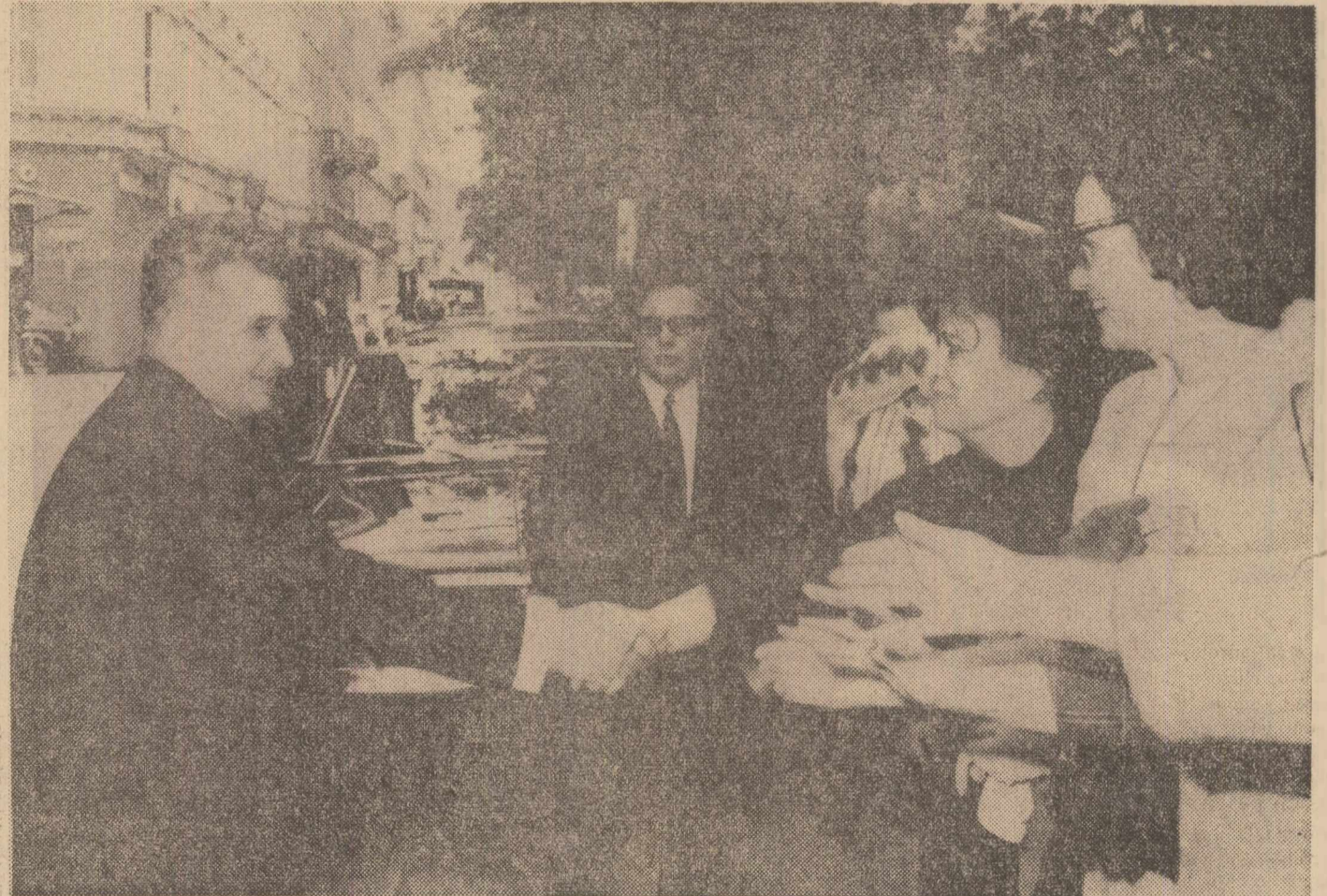
În fața hotelului Imperial