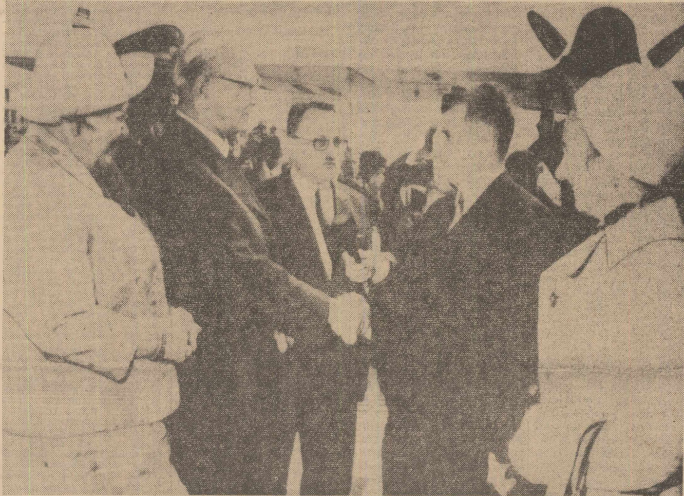
La sosire, pe aeroportul Schwechat

Avionul oficial cu care călătorește președintele Nicolae Ceaușescu și celelalte personalități române decolează la ora 10.