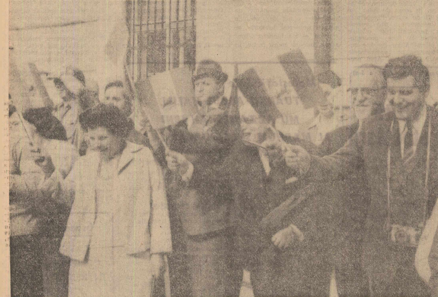
Mulțimea aclamînd coloana oficială pe străzile Vienei