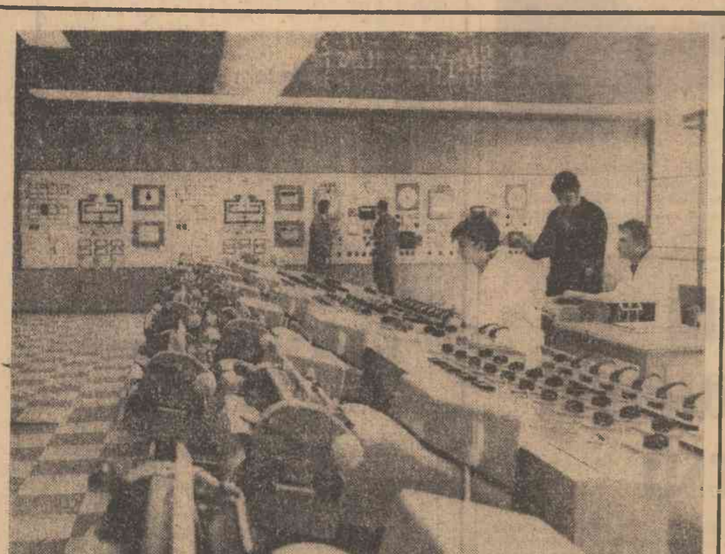
Având un proces tehnologic automatizat, fabrica de articole de sticlărie București, cea mai mare de acest gen din țară, realizează anual peste 9 000 000 produse din sticlă. În clișeu: sala tabloului general de dirijare a procesului tehnologic.

Joi dimineața, tovarășul Nicolae Ceaușescu, secretar general al Partidului Comunist Român, s-a întâlnit într-o consfățuire de lucru, la sediul C.C. al P.C.R., cu specialiști din domeniul tehnicii de calcul și prelucrării automate a datelor, oameni de știință, cadre didactice din învățământul superior, directori și ingineri șefi din mari întreprinderi.