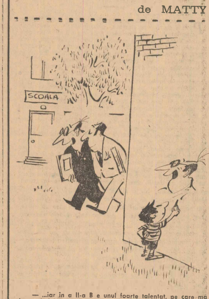
— Iar în il-lia B e unu foarte talentat, pe care mă bate gîndul să-l dirije spre pictura murală...