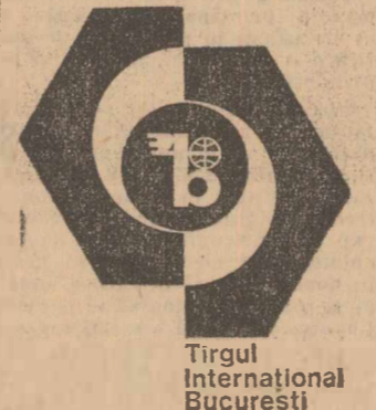
Tîrgul Internațional București

broșuri, fotografii etc.) — va oferi și posibilitatea organizării de programe turistice: vizitarea litoralului românesc și a Doltei Dunării, excursii pe Valea Prahovei și la Brașov, la minăstria din nordul Moldovei, la rușinile podgorii de la Valea Călugărească și din zona Piteștului pentru degustări de vinuri și cules de vii etc. Și, dînd fiind faptul că o serie de vizitatori la Tîrg vor veni împreună cu familiile lor, se arde în vedere organizarea de programe speciale pentru acestea: vizite la Palatul Pioneerilor, la muzeu, la Casa de modă, la expoziții etc.