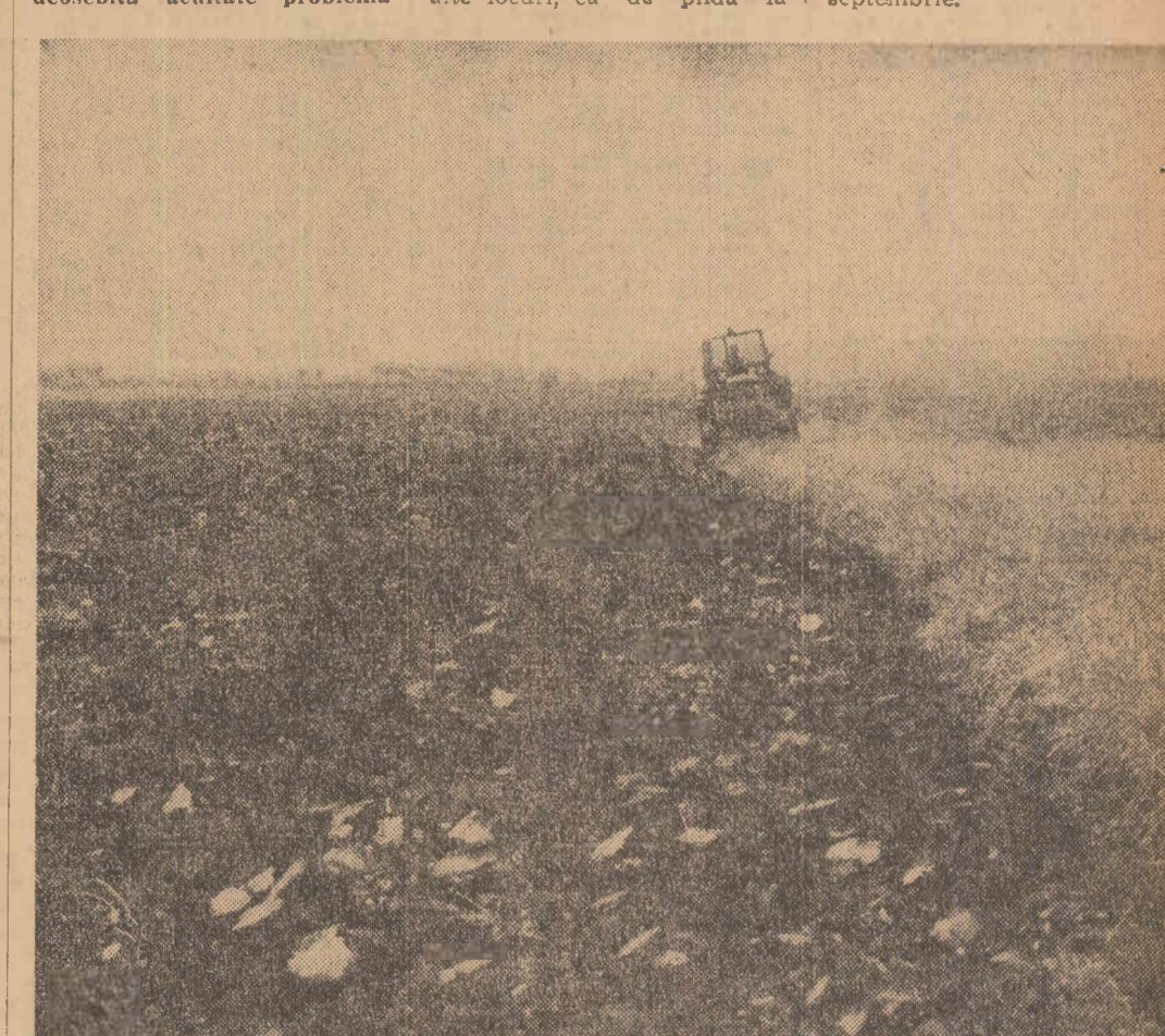
O zi ciștigătoare acum la arături înseamnă — un plus de recoltă la vară. Iată de ce mecanizatorii care servesc cooperativa agricolă din Fierbinți, județul Ilfov zoresc, în aceste zile, pregătirea tuturor terenurilor pe care peste puțină vreme, semănătorile vor pune grîul.

Spre a se realiza încadrarea în perioada optimă la semănat este imperios necesar ca, în aceste zile din ecucțiile agricole deosebite și mîniunile cooperative, conducerea cooperativei agricole și șefii secțiilor de mecanizare din I.M.A. să ia măsuri de mobilizare a tuturor forțelor pentru grăbirea recoltării culturilor de toamnă și pentru accelerarea ritmului de execuție a arăturilor pe toate ferurile pe care urmează să se pună grîul, fără ca aceasta să se facă în dauna calității. Asigurarea frontului de lucru pentru mecanizatori, începerea lucrului din zor și încheierea lui seara, țirzul, organizarea lucrului pe tractoare în schimburi prelungite sînt modalități eficiente ce se cer aplicate în toate unitățile, pentru recuperarea rămînelor în urmă, în deosebi în județele unde semănatul grîului debutează în jurul datei de 25 septembrie.