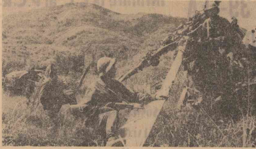
În ultimul timp, forțele patriotice din Vietnamul de sud au doborât numeroase avioane și elicoptere inamice, capturând, totodată, importante cantități de material de război. În fotografie: unul din aparatele de zbor inamice doborât de patrioții din provincia Quang Tri.

Comunicatul comun dat publicității la sfârșitul vizitei sintetizează rezultatele acestor întrebări, subliniind dorința celor două părți de a dezvolta și intensifica colaborarea bilaterală în domeniile economic, cultural, artistic și asistenței tehnice.