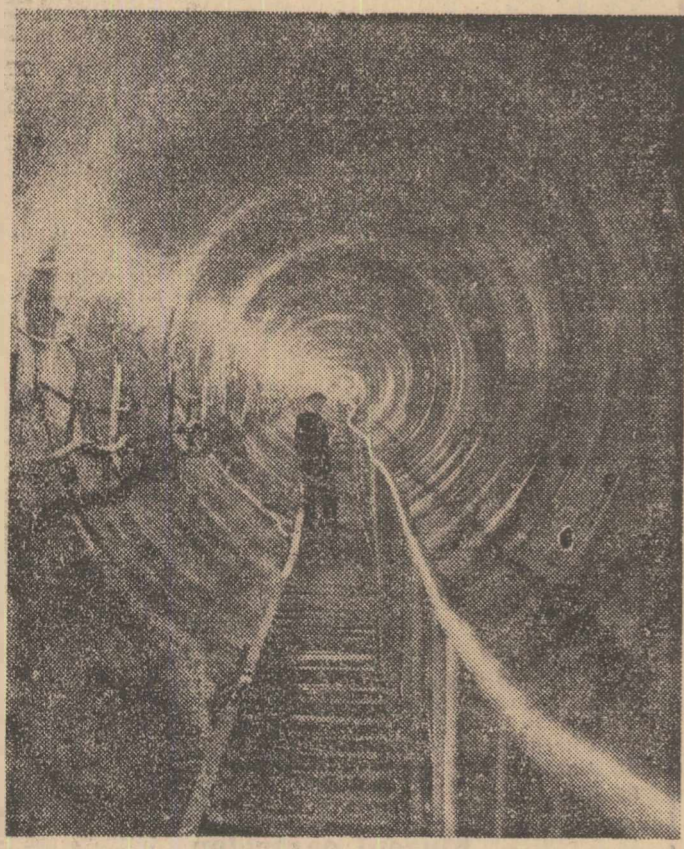
Executat la o înclinare de 32 de grade față de orizontală și având un diametru de patru metri galeria forțată a Centralei hidroelectrice subterane de pe Lotru se înscrie printre cele mai remarcabile și îndrăznețe lucrări de construcție din țara noastră. După ce vor parcurge cei peste 1 300 metri ai acestei galerii, pe care v-o prezentăm în clișeu de mai sus, apele venite din lacul de acumulare prin tunelul de aducțiune vor pune în mișcare turbinele centrale.