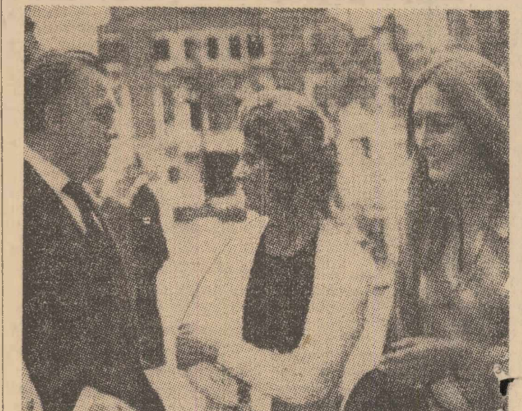
Regizorul italian Federico Fellini, câștigătorul „Premiului criticilor” cu filmul său „Clovni”, alături de actrițele Alida Valli și Rossella Falk, în fața Palazzo del Cinema din Veneția