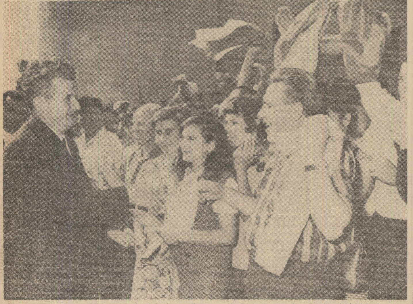
Conducătorul partidului și statului a fost întâmpinat cu vibrante manifestări de dragoste, de cetățenii municipiului Arad

Toate garniturile trenurilor au fost dotate cu vagoane noi, dispunind de vagoane-restaurant sau vagoane-bar. În ceea ce privește procurarea biletelor, pe lângă cele două agenții CFR, din Constanța, prevăzute cu 20 de case și cele din Eforie-Nord, Eforie-Sud, Techirghiol și Mangalia, alte două agenții au fost înființate în stațiunile Jupiter și Venus din nordul Mangaliei.