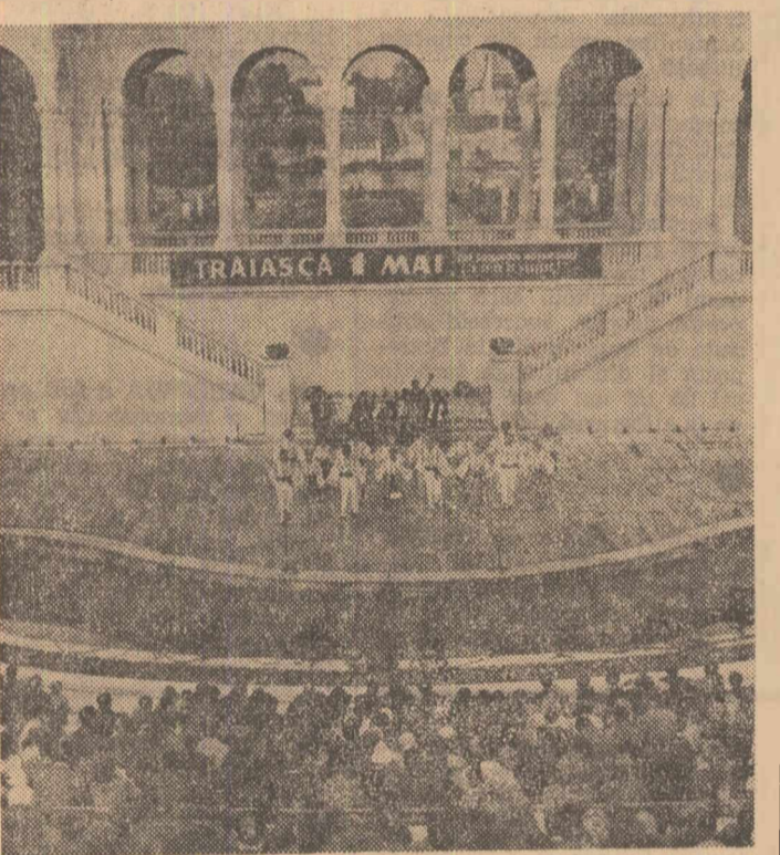
După amiază, bucureștenii au asistat la spectacolul oferit pe scena Teatrului de vară „23 August” de echipele artiștilor amatori

La Reșița, în cea mai virșitoasă cetate de foc a țării, această zi a fost marcată de un eveniment memorabil. Înaintea de a ieși la demonstrație, constructorii de mașini au încheiat cu succes probele de încercare la cel de al 900-lea motor destinat locomotivelor Diesel electrice.