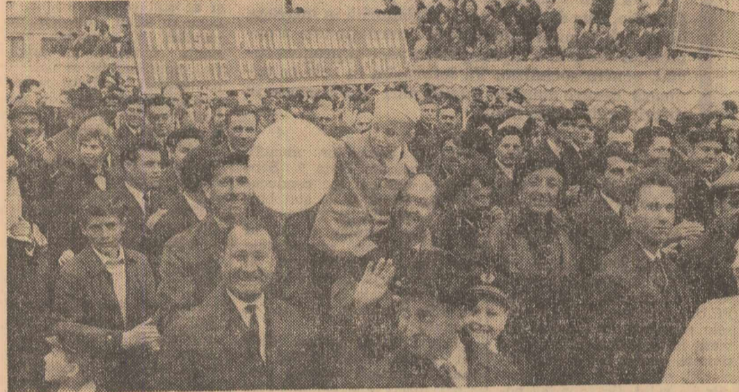
La Galați, orașul marelui combinat siderurgic înălțat pe malul bătrânului Danubiu, oamenii muncii își manifestă dragostea fierbinte și atașamentul față de politica internă și externă a iubitului nostru partid

Coloanele sărbătorești ale lui 1 Mai au constituit un simbol expresiv nu numai al muncii ci și al înfrățirii. În numeroase dintre corespondențele pe care le-am primit este zugrăvit entuziasmul cu care oamenii muncii aparținând naționalităților conlocuitoare au demonstrat alături de cei români, așa cum și în muncă, în activitatea de fiecare zi sint alături trăind în deplină armonie și înțelegere.