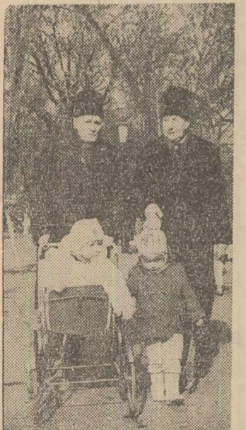
lori a fost o zi de autentific primăvară. Iată doi bunici care — fără să-și uite căciulele — au ieșit cu nepoții, la plimbare, în Cișmigiu

Am petrecut o zi întreagă în localul din strada Roma nr. 7 — unde se află întreabă ghișee a numeroase instituții care prin excelență au un larg contact cu publicul: notariat, ADAS, oficiu de pensii, C.E.C. circumscripție financiară — urmărind depistarea unor incidente nepăcute pentru cetățean. A fost însă ghinionul nostru și norocul cetățenilor, ca în acea dimineață — cu predispoziția creată probabil de primăvara prematură — să asistăm la un adevărat „vals al politetii”, al solitudinii, al operativității. Și dacă, poate pe nedrept, simțem tentați să considerăm aceasta o excepție, este doar pentru faptul că prea des am avut de-a face cu funcționari agresivi — poate mereu aceiași — care, prin comportare, au denigrat marea masă a colegilor ireproșabili. Acei nenumărați oameni care în opt ore de lucru, au de-a face cu sute de cetățeni, cu sute de susceptibilități și irascibilități, cu sute de variante de înțelegere, cu sute de moduri de exprimare — și nu întotdeauna academice, cu sute de părereri și protenții — și nu întotdeauna întemeiate, cu sute de oameni care se perindă prin fața ghișeului în timp ce, de