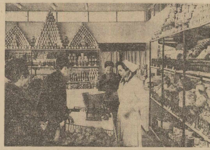
Un nou complex alimentar a fost deschis pe șosaua Bercești, la nr. 183. Noul complex dispune de mobilier modern, de patru camere frigorifice pentru păstrarea produselor, rampă de descărcare și alte dotări care asigură vinzarea produselor în condiții optime. La dispoziția cumpărătorilor stau raioane cu autovehicle precum și secții de mezeluri, brînzetură, măcelărie, piine, dulciuri etc. În clădire: Unitatea de legume și fructe.

Cu prilejul împlinirii a două decenii de la crearea Palatului pionierilor din București, care se va sărbători în primăvara acestui an, au fost organizate concursuri pe diferite teme din domeniul științei și tehnicii, artei, culturii și sportului.