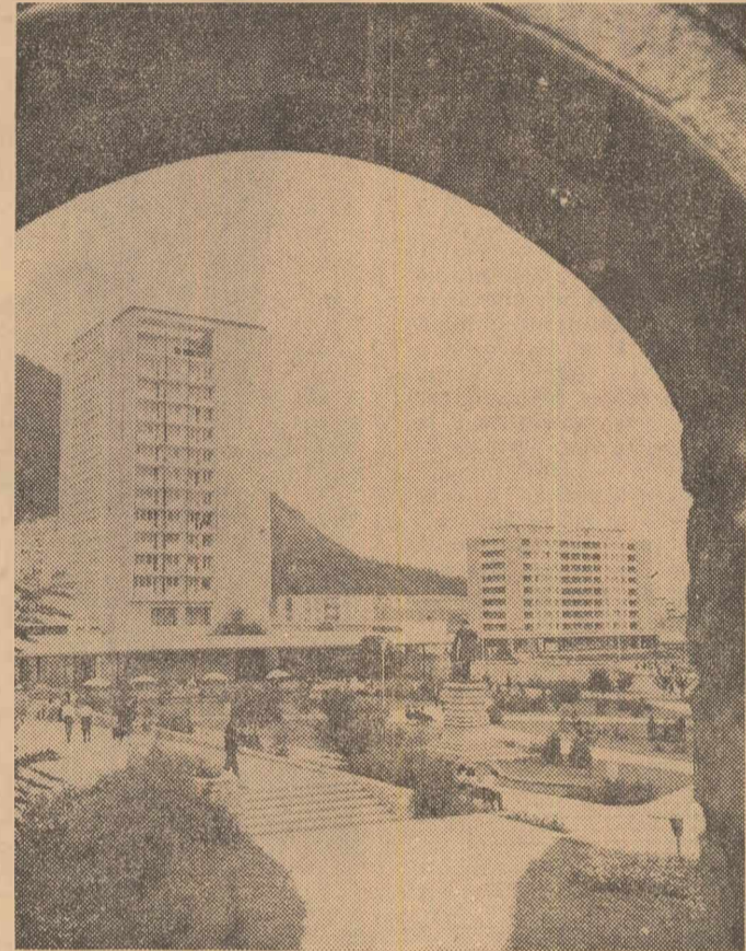
Peisajul modern al orașului Piatra Neamț se încadrează armonios în ambianța naturală a acestui vechi și frumos centru urban al țării noastre

complex echipată, care, din punct de vedere arhitectonic, reprezintă o soluție funcțională economică, reunind într-o singură clădire atât blocul de trafic calătoriilor cit și cel tehnic și industrial. O nouă aerogară, în același sistem, va fi construită și la Bacău. Clădirea respectivă va avea un turn de control de 27 metri, pentru a corespunde condițiilor locale de trafic. La rândul său, aeroportul de la Satu Mare va fi și el modernizat într-o etapă apropiată. Datorită cerințelor moderne de zbor o serie de aeroporturi vor avea asigurate condiții de zbor atât ziua cit și noaptea. După aeroporturile de la Iași, Suceava, Tg. Mureș și Oradea, recent modernizate, vor beneficia de aceste condiții și cele de la Cluj și Sibiu în 1970 și de la Deva și Tulcea în viitorul cincinal.