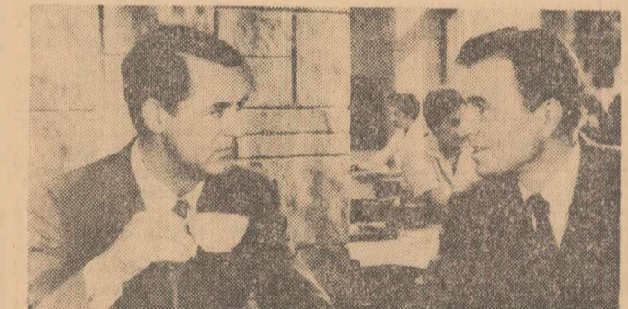
Cary Grant (Roger Thornhill) și James Mason (Philip Vandam) într-o scenă din film.