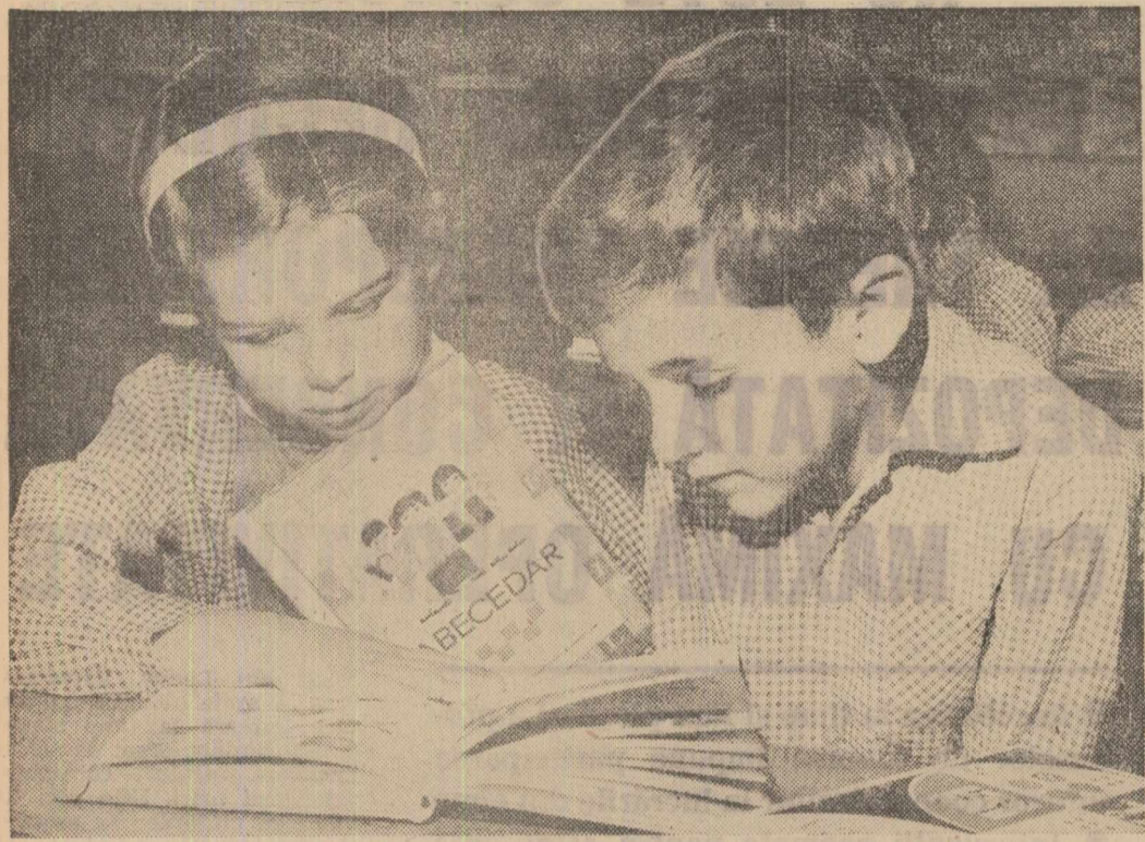
Prima cunoștință cu abecedarul la Liceul nr. 36 din Capitală