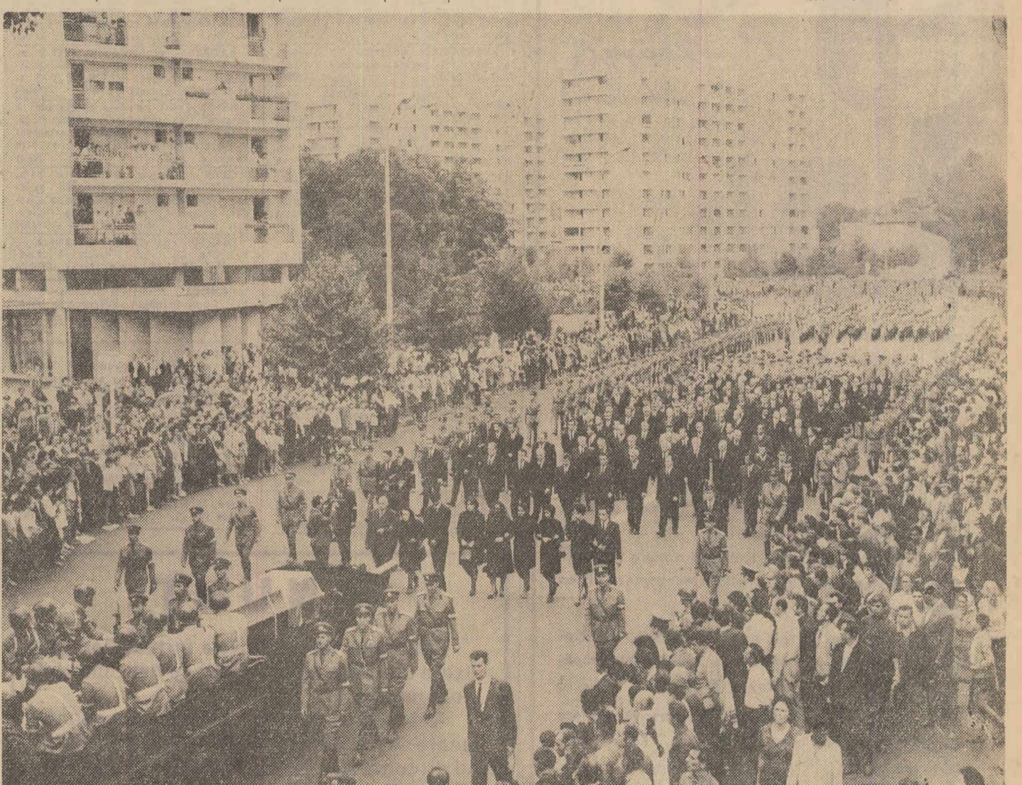
Cortegiul funerar pe străzile Capitalei

PREZIDIUL C.C. AL FRONTULUI PATRIEI DIN VIETNAM