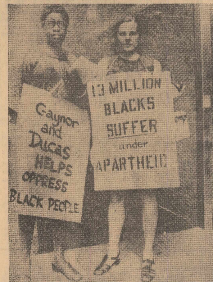
Membri ai Comitetului american pentru Africa demonstrînd, pe străzile New Yorkului, împotriva politicii de apartheid promovată de regimul rasist din Rhodesia

O creștere simțitoare — conform aceluiași sursă oficiale — au înregistrat și livrările R.F. a Germaniei către unele țări socialiste. Cele mai importante creșteri în primul semestru al acestui an, față de perioada corespunzătoare a anului 1968 au cunoscut livrările vest-germane către U.R.S.S. (55,9 la sută), Cehoslovacia (31,8 la sută), R.P. Chinei (23,1 la sută), Polonia (5,2 la sută). Se prevede pentru cel de-al doilea semestru 1969 o nouă creștere simțitoare a livrărilor R.F. a Germaniei spre aceste țări.