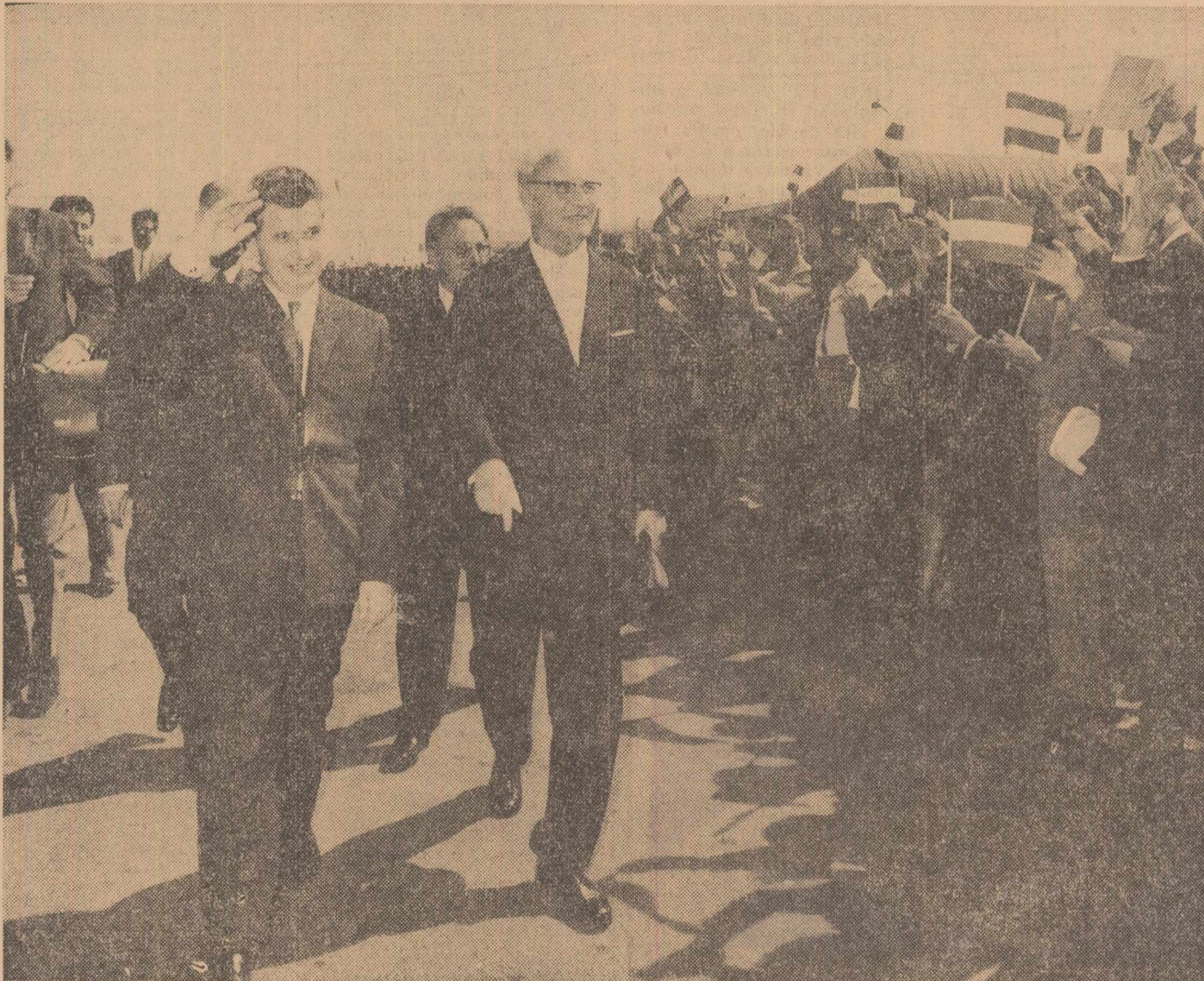
Numeroși bucureșteni veniți pe aeroport aplaudă cu căldură pe cei doi conducători de stat

Ziarul „Arbeiter Zeitung” publică, de asemenea, extrase dintr-un comentariu difuzat de Agenția Română de presă în care se subliniază că această vizită reprezintă o etapă calitativ nouă în relațiile dintre cele două țări.