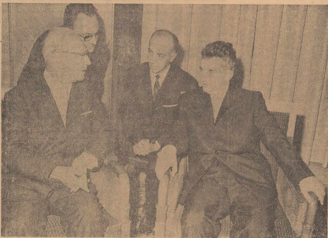
În timpul vizitei protocolare la Consiliul de Stat

Vă rog să-mi permiteți să vă transmit salutul meu personal și al poporului austriac dumneavoastră și poporului român. (Aplauze îndelungate)