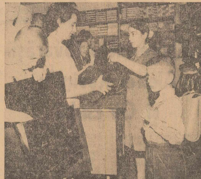
În aceste zile, librării cunosc o însemnată afloare de cumpărături. Cliseul nostru vă înfățișează un instantaneu de la secția de papetărie a librăriei „Mihail Eminescu” din Capitală