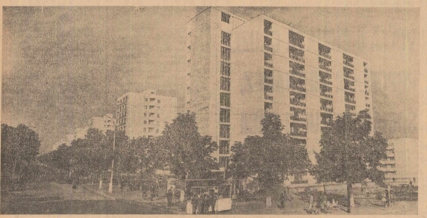
Blocuri de locuințe din cartierul Crina din orașul Buzău

Abuzul continuă, de asemenea, să pună pe cetățeni în situația de nesocotit timp de doi ani această obligație elementară față de angajatul său. A trebuit ca acesta să se adreseze Ministerului Muncii pentru ca să intre în posesia drepturilor bănești la care are dreptul închipi oricine ce s-ar împiedica dacă fiecare unitate și-ar interpreta obligațiile ce decurg din contractul de muncă în felul celor de la Caraș-Severin.