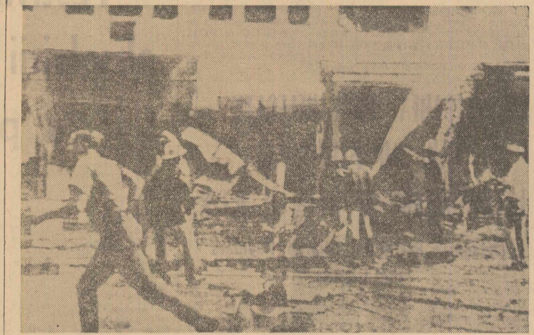
Fotografia înfățișează un grup de pompieri încercând să stingă incendiul produs la o clădire din capitala sudvietnameză, în urma bombardamentelor efectuate de patrioți

Marti, ministrul afacerilor externe al Republicii Socialiste România, Corneliu Mănescu, va fi primit de președintele R.S.F. Iugoslavia, Iosip Broz Tito.