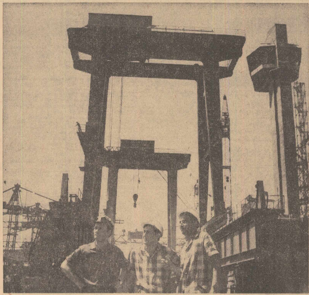
În aceste zile constructorii de pe șantierul sistemului hidroenergetic de la Porțile de Fier își intensifică eforturile pentru realizarea cu succes a celor două mari obiective: închiderea definitivă a albiei Dunării și inaugurarea navigației vaselor prin ecluza de pe malul românesc. În clișeu: Aspect din zona podului fix de peste ecluză