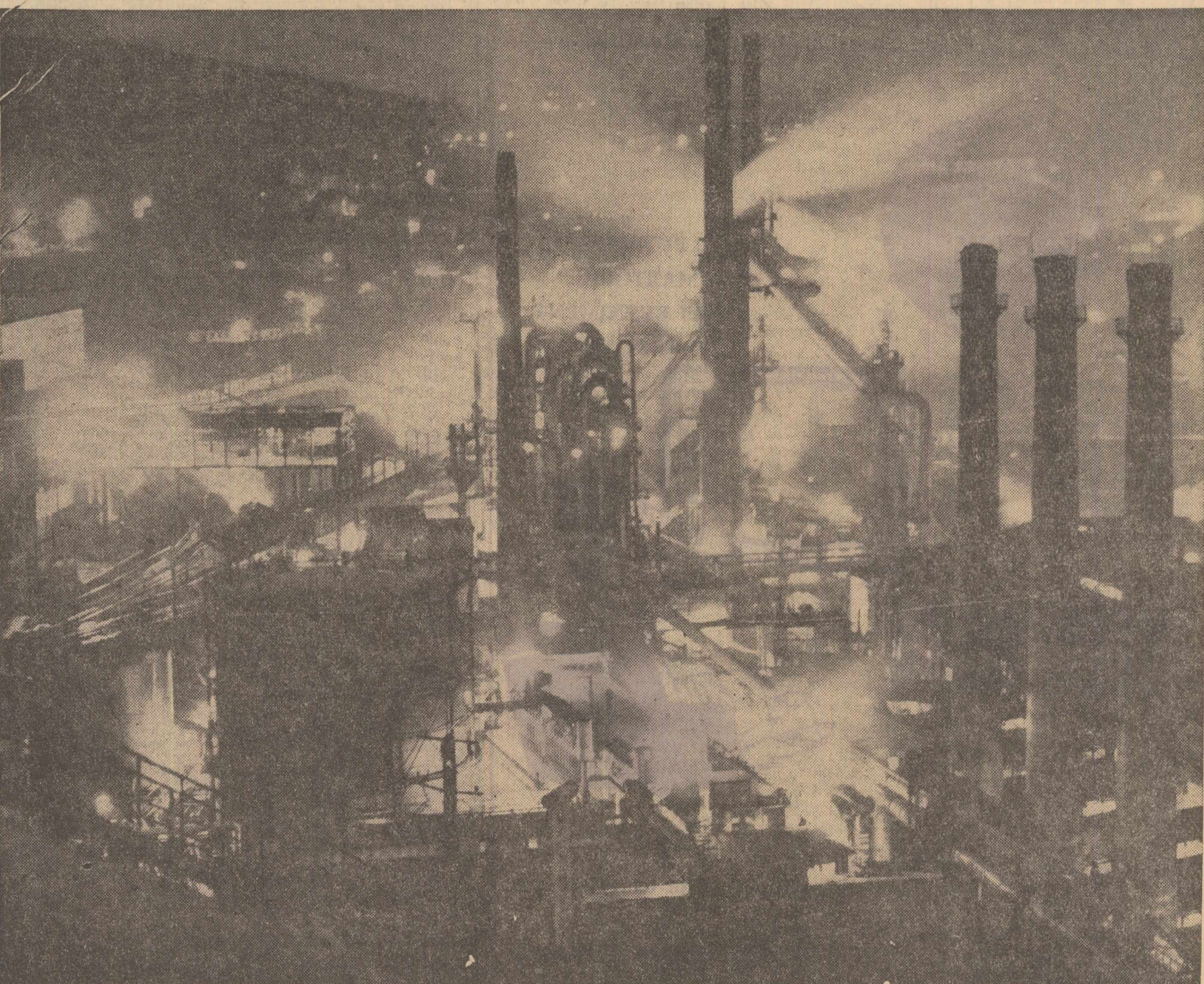
Noaptea Reșiței au ceva din incandescența metalului ce se făurește aici, dar predominant este lumina focurilor nestinsse care înroșește cerul orașului-uzină de aproape două sute de ani