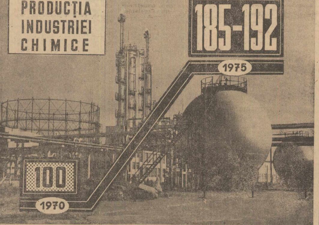
„Industria chimică trebuie să ocupe un loc principal în dezvoltarea economiei, ținînd seama de materiile prime existente în țară, de cerințele crescînde de produse chimice pentru consumul intern și de posibilitățile de export pe care le arecază. Producția acestei ramuri va crește pînă în 1975 cu 85-92 la sută, într-un ritm mediu anual de 13-14 la sută, îndeplinînd pe baza chimizării gazului metan, a produselor petroliere și valorificării resurselor de sare”. (Din Proiectul de Directive ale Congresului al X-lea al Partidului Comunist Român)