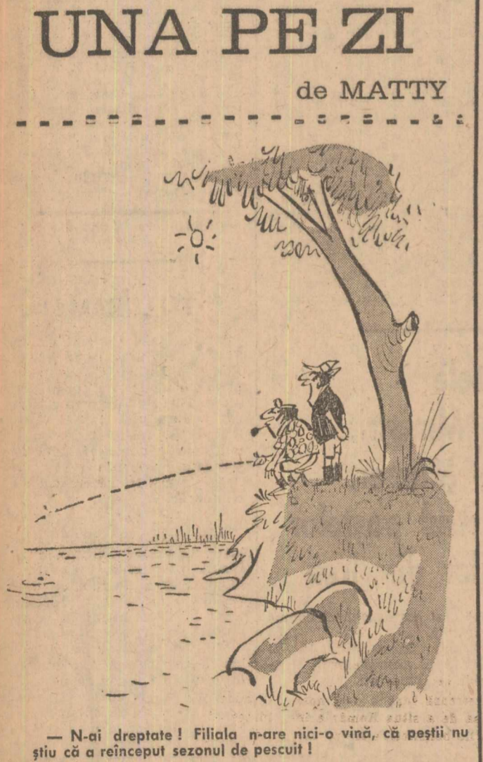
— N-ai dreptate! Fiila n-are nici-o vină, că peștii nu știu că a început sezonul de pescuit!