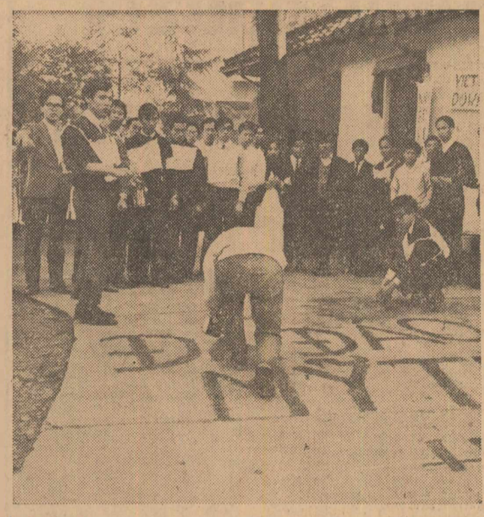
Imaginea de mai sus a fost surprinsă în timpul unei recente demonstrații care a avut loc la Motoyogicho, Tokio, în fața oficiului în care își are sediul reprezentanții cizii saigoaneze. Mii de persoane care au luat parte la această demonstrație au protestat împotriva intervenției americane în Vietnam și împotriva sprijinului pe care S.U.A. îl acordă pentru a menține la putere guvernul marionetă al lui Thieu. În timpul demonstrației, care a durat o zi și o noapte, manifestații au scandal lozinci în favoarea încetării intervenției și pentru instaurarea păcii în Vietnam.