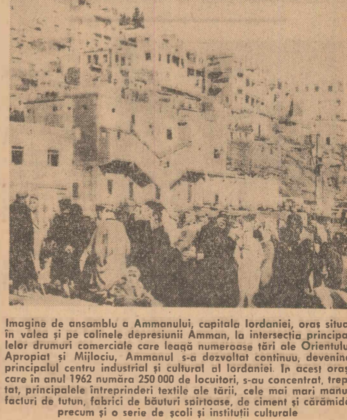
Imagine de ansamblu a Ammanului, capitalei iordaniei, oraș situat în valea și pe cîlnile depresionii Amman, la intersecția principalelor drumuri comerciale care leagă numeroase țări ale Orientului Apropiat și Mijlociu, Ammanul s-a dezvoltat continuu, devenind principalul centru industrial și cultural al Iordaniei. În acest oraș, care în anul 1962 număra 250.000 de locuitori, s-au concentrat, treptat, principalele întreprinderi textile ale țării, cele mai mari manufacturi de tutun, fabrici de băuturi sărace, de ciment și cărămidă precum și o serie de școli și instituții culturale

prașilei întîrzie în mod nejustificat. Dacă la C.A.P. din DOPCA, FAGARAS, JIBERT, ZĂRNEȘTI și RUPEA, răritul la sîcșia de zahăr a fost realizat în întregime, în alte cooperative această lucrare este mult rămasă în urmă. O asemenea situație există la cooperativa agricolă din SACELE unde răritul nu s-a realizat decît pe 12 la sută din suprafață, la COBOR, SÎNPETRU și altele. Orice întîrziere a lucrărilor de combatere a buruienilor și a dăunătorilor — indeșeabil a răștoareii și gîndacului de Colorado — poate determina pagube importante de recoltă. Iată de ce este imperios necesar ca Direcțiile agricole și unitățile județene cooperative, conducătorii I.A.S. și I.M.A., agronomii, comisiile de conducere din C.A.P. să facă tot ce le stă în putință pentru a se realiza, în aceste zile, o maximă întreținere a tuturor forțelor și mijloacelor la întreținerea culturilor. Prețindînd lucrările trebuie făcute în timp, în un nivel calitativ corespunzător, fără a se prejudicia densitatea plantelor pe hectar. Numai astfel toate unitățile vor putea pune la toamnă pe cîntar recolte superioare prevederilor de plan.