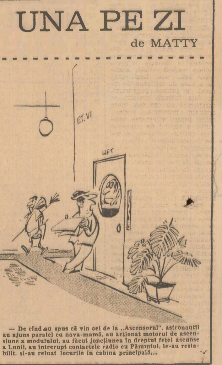
— De cînd au spus că vin cei de la „Ascensori”, astronautii au ajuns paralel cu nava-mamă, au acționat motorul de ascensiune a modului, au făcut joncțiunea în dreptul feței ascensibile, și-au reluat locurile în cabina principală...

O deosebită dezvoltare a luat în ultimul sfert de veac industria conservelor sterilizate în recipiente. Prin cunoașterea din ce în ce mai profundă a factorilor și a condițiilor care micșorează conținutul în unele trone termolabile (vitamine, aminoacizi etc.) și prin progresele tehnice, azi se obțin conserve de căror valoare nutritivă este egală cu aceea a produselor naturale prelucrate termic (fierte sau prăjite). Deși există mici pierderi și pierderile organoleptice ale alimentelor autoclavate se modifică, totuși conservele măresc considerabil posibilitățile omului de a se alimenta rațional. Sterilizarea, ca și congelarea, permitînd conservarea îndelungată și transportul alimentelor perisabile la mari distanțe, înlătură nesigurările producției intermitente pentru aprovizionarea continuă și oferă posibilitatea ca omul să dispună în tot cursul anului de produse necesare acțiunii unui meniu echilibrat de bună calitate, condiție esențială pentru trecerea de la alimentația empirică la cea fundamentată pe cercetările științifice. În același timp, prin distrugerea microorganismelor se evită riscul transmiterii prin alimente a unor boli parazitare sau bacteriene și prin lărgirea sortimentului de produse alimentare se poate asigura diversitatea meniului, ceea ce contribuie la mulțumirea consumatorului.