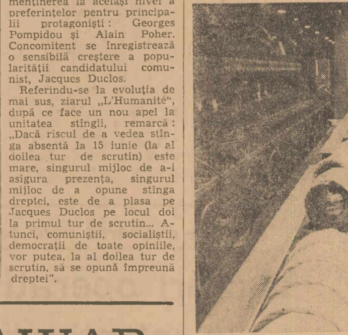
Aspect din secția de filatură a fabricii de fibre sintetice „Ducilo“ din Berazategui, Argentina

Într-un moment cînd în parlamentul australian aveau loc dezbateri vii în problema prezenței bazelor militare străine în Australia, la Canberra s-a anunțat amplasarea unei noi baze americane pe pământ australian, cea de a treia de acest fel. După cum se știe, bazele americane North-West-Cape, situată pe coasta vestică a țării, și Pine Gap, construită în plin deșert, la 20 km sud de Alice Springs, au fost prezentate în mod public ca baze comune de cercetări științifice. Ziarul Sydney Sun a fost primul care a dat alarma, precizînd că este vorba pur și simplu de baze militare străine. În Australian Quarterly, Robert Cooksey, profesor la Universitatea națională din Canberra, a denunțat categoric bazele de la North-West-Cape și Pine Gap, arătînd că în ambele cazuri este vorba de puternice amplasamente militare americane, prima fiind însărcinată cu asigurarea unui contact permanent cu submarinul Polaris ca-