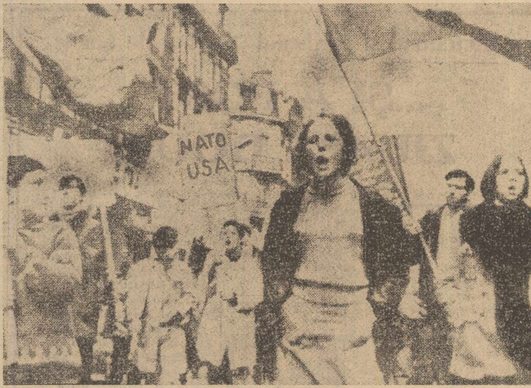
În cadrul unei demonstrații împotriva N.A.T.O. ce s-a desfășurat recent în capitala Belgiei Bruxelles, participanții au cerut desolidarizarea țării lor de acest pact militar anarhic, a căru activitate contribuie la reînvierea războiului rece și constituie o barieră în calea destinderii internaționale și a consolidării păcii în Europa și în lumea întreagă

CARACI 6 (Agerpres). — Valul revendicărilor sociale ia tot mai mult amploare, antrenând noi categorii de salariați. După greva celor aproximativ 10.000 de docheri, care a afectat serios activitatea portului Caraci, au încercuit brațele lucrătorii de la societatea de gaz, în timp ce salariații poștei întrerup tot mai des munca lor, închinând traficul. La rândul lor, funcționarii de la compania aeriană națională au prezentat autorităților revendicări asupra cărora sînt în curs negocierii. Profesorii de la Universitatea din Caraci au declarat greva foamei în sprijinul revendicărilor colegilor lor.