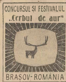
CONCURSUL ȘI FESTIVALUL „Cerbul de aur“ BRASOV-ROMANIA

a interpretat cu căldură — pentru a doua oară în aceeași seară — „Of, inimiard“, apoi s-a consumat între cîntec și dans stîrnind aplauze ritmice