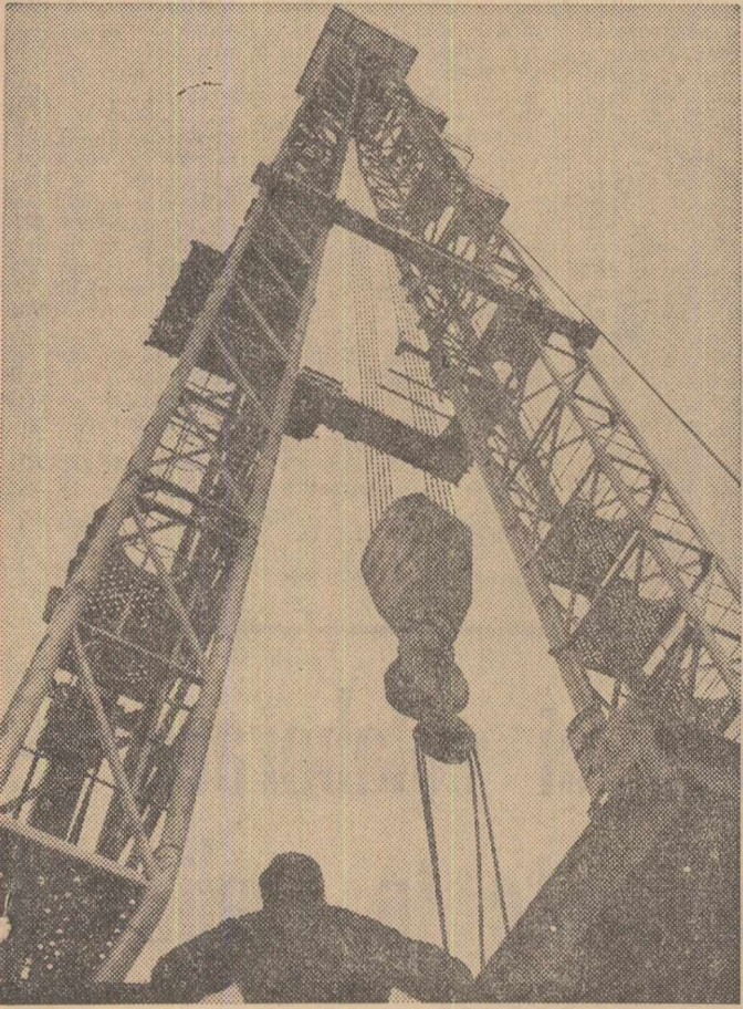
Instalațiile de foraj și extracție a petrolului produse de Uzinele „1 Mai” din Ploiești se bucură de aprecieri unanime atât pe piața internă, cât și peste hotare. În acest an ele au contribuit la realizarea integrală și înalte de termen a sarcinilor din Planul de Stat ale Ministerului Petrolului. În imagine: un aspect din etapa de verificare a instalațiilor realizate la uzina ploieșteană

La 10 decembrie a.c., președintele Consiliului de Stat al Republicii Socialiste România, Nicolae Ceaușescu, a primit pe ambasadorul extraordinar și plenipotențiar al Republicii Arabe Siriene, Ali Al Kosh, în legătură cu prezentarea scrisorilor de acreditare. (In pag. a 5-a, cuvântările rostite cu acest prilej).