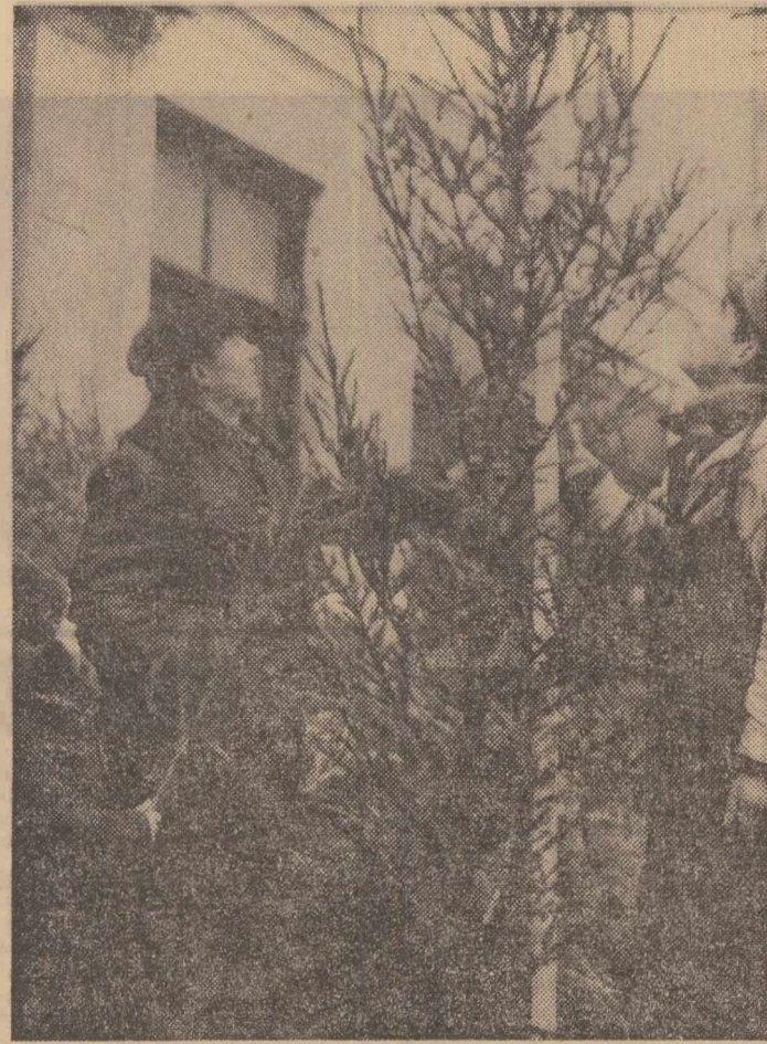
Primii soli ai noului an — pomii de iarnă — și-au făcut apariția în piețele bucureștene

Ambasadorul Republicii Arabe Siriene a fost însoțit de membri ai ambasadei.