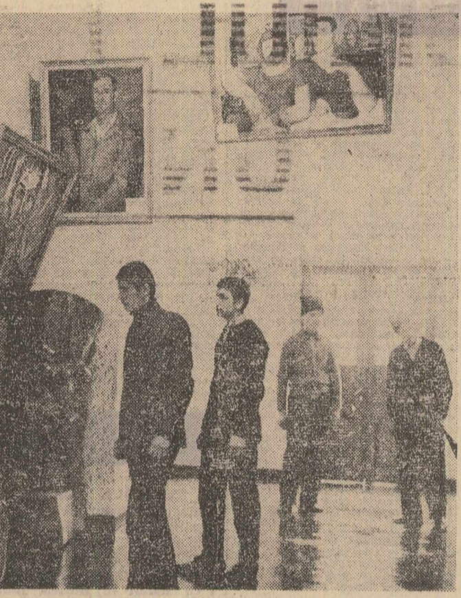
În comuna Smeeni din județul Buzău funcționează un muzeu format din 3 secții: plastică, etnografie și arheologie...