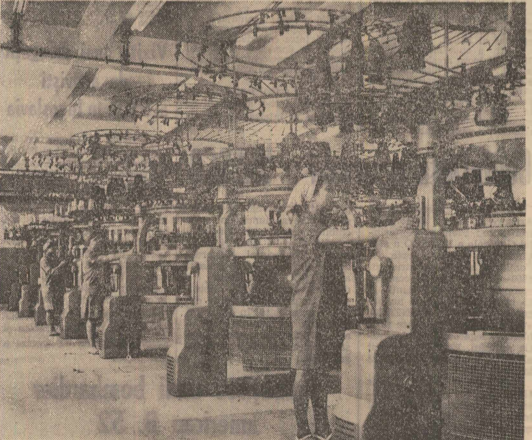
La Fabrica de tricotate „Tînăra gardă” din Capitală au intrat în producția de serie, în cursul acestui trimestru, peste 90 de modele noi de tricot, din fire PNA și lînă pură, cu mare varietate de culori. În clișeu: secția mașini de tricotat din cadrul fabricii de tricotate „Tînăra gardă”

Joi seara în sala sporturilor de la Floreasca are loc un interesant cupaj internațional de baschetbalistic. De la ora 18,30 echipa feminină Politehnica București se va întâlni cu Radnicki Belgrad în cadrul „Cupii campionilor europeni”. Returul este programat la 23 noiembrie la Belgrad. În meciul „vedetă” se întalnesc echipele masculine Dinamo București și E.K.E. Viena într-un joc conținut de asemenea, pentru „C.E.E.”. În primul meci, baschetbaliștii austrieci au obținut victoria cu scorul de 88—75.