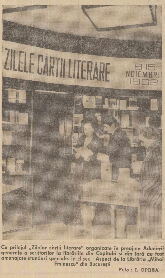
Cu prilejul „Zilelor cărții literare” organizate în preajma Adunării generale a scriitorilor la librăria din Capitală și din țară au fost amenajate standuri speciale. În cișeu: Aspect de la Librăria „Mihai Eminescu” din București