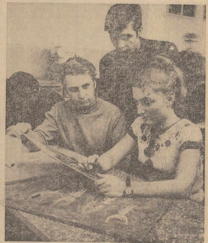
Aspect de la Școala de specializare postliceală de construcții și arhitectură din București la care învață în acest an aproape 1.400 de elevi în specialitățile arhitectură, construcții, topografie, instalații și altele. În clipș: un grup de elevi în timpul orei de desen ornamental

Intrată de curind în producție, noua întreprindere va livra până la sfârșitul anului circa 1.500 tone halva.