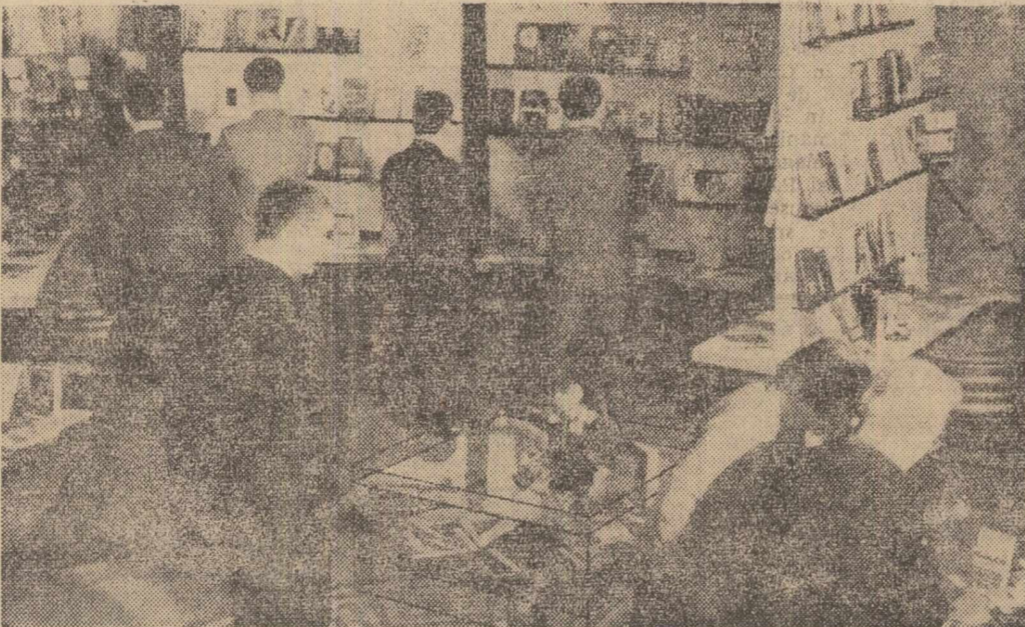
Aspect din expoziție