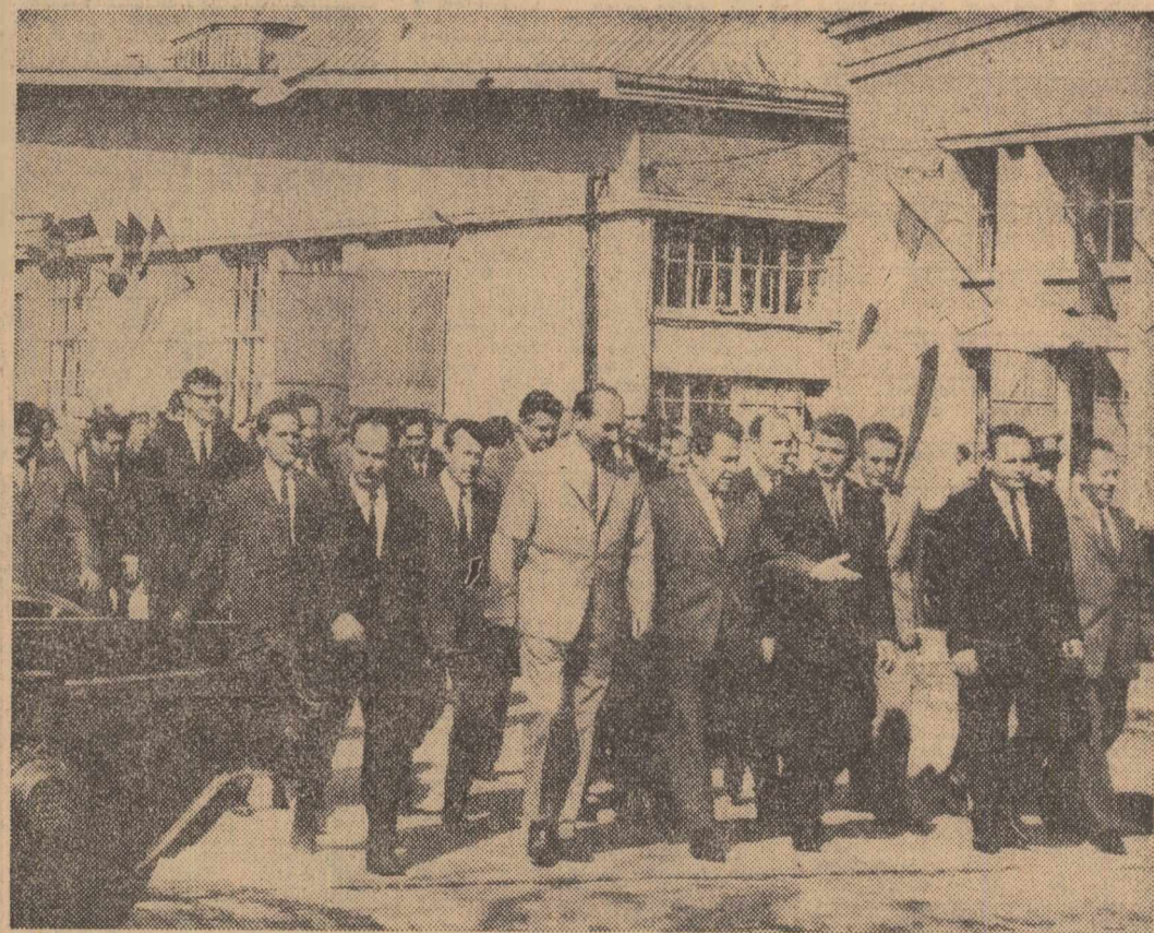
La uzinele de vagoane din Arad

Vă urez tuturor multe succese în activitatea dumneavoastră, multă sănătate și multă fericire. (Aplauze furtivoase, urale care nu conțenez minute în șir).