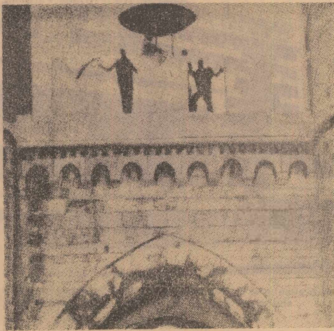
În drumul său din Grecia spre Mexic, flacăra olimpică va poposi, pentru o zi, la Genova. După cum informază ziarul Corriere della Sera, ea va fi adusă în orașul genovez, la 27 august, de nava militară greacă „Navarrino” și, după ce va fi plimbată pe străzile orașului, va fi purtată spre anticul turn Porta Soprana, aflat în imediată vecinătate a casei natale a lui Cristofor Columb. Aici, pe un loc anume amenajat (care se vede în imagine) flacăra olimpică va arde toată noaptea, iar dimineața va fi predată comandantului navei militare italiene „Pallinuro”, care o va transporta la Barcelona. În continuare, flacăra olimpică va fi predată unei nave mexicane, prin intermediul căreia va ajunge în orașul Olimpiadei, Ciudad de Mexico.

Copreședinții comitetului celor 18 au arătat că fiecare delegație are dreptul să ridice și alte probleme în cursul viitoarelor întîlniri de la Geneva.