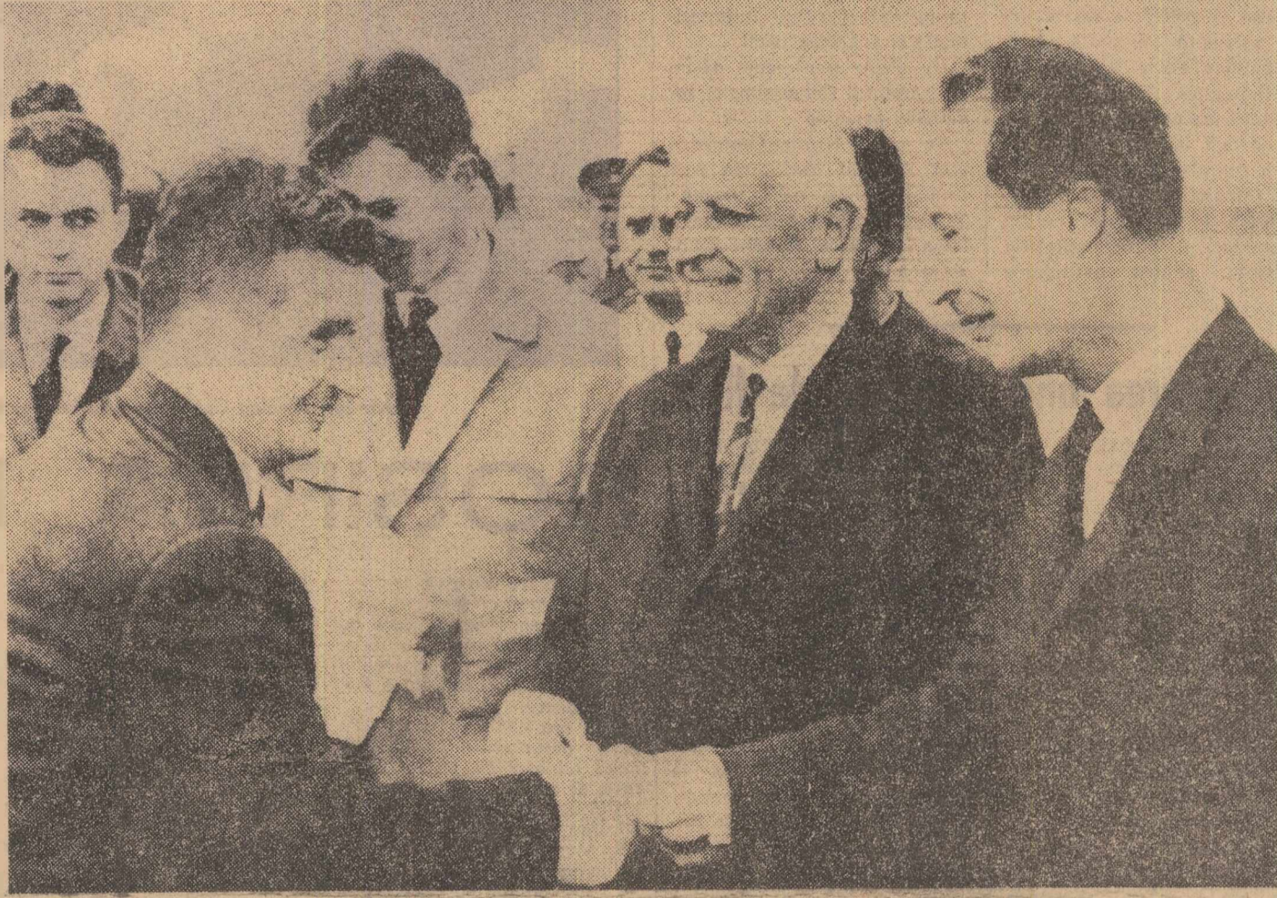
La sosire, pe aeroportul Ruzyne din Praga

Zburind deasupra teritoriului Republicii Populare Ungare, în drum spre Republica Socialistă Cehoslovacă, vă transmitem dv. personal și poporului, frate ungar cordiale salutări și urări de noi succese în opera de construire a socialismului în patria dumneavoastră.