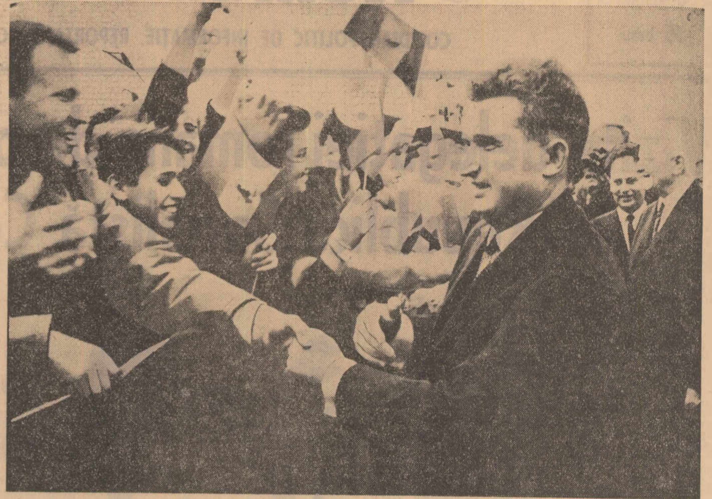
Tovarășul Nicolae Ceaușescu este înfîmpinat cu entuziasm de către populația pragueză

Tovarășul Nicolae Ceaușescu și-a încheiat cuvîntarea rostind în limba cehă urarea: Trăiască prietenia și solidaritatea frățească româno-cehoslovacă!