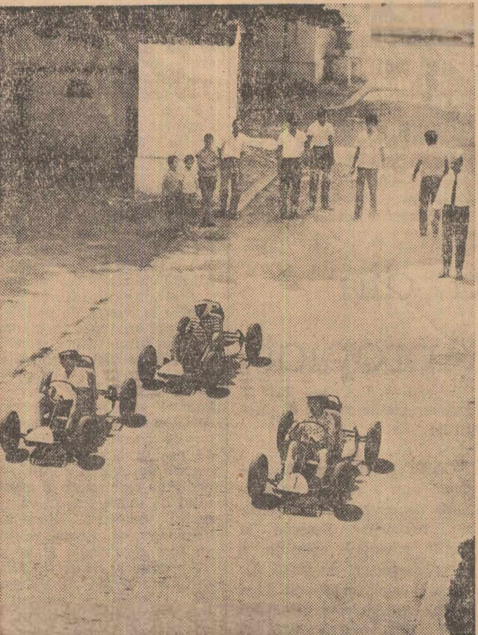
Zi de antrenament la carting pe pista amenajată în curtea Palatului pionierilor din Capitală

În cursul vizitei, delegația a fost primită la C.C. al P.C.R., la C.C. al U.T.C., a luat cunoștință de munca or-