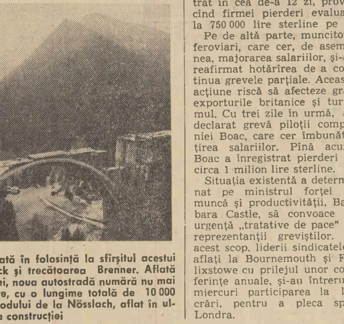
O modernă autostradă va fi dată în folosință la sfîrșitul acestui an între orașul austriac Innsbruck și trecătoarea Brenner. Aflată într-o fază avansată a construcției, noua autostradă numără nu mai puțîn de 42 de poduri și viaducte, cu o lungime totală de 10.000 metri. În fotografie: Vedere a podului de la Nösslach, aflat în ultimă fază a construcției