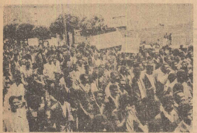
În capitala Salvadorului a avut loc cerutul o mare demonstrație a profesorilor și studenților...