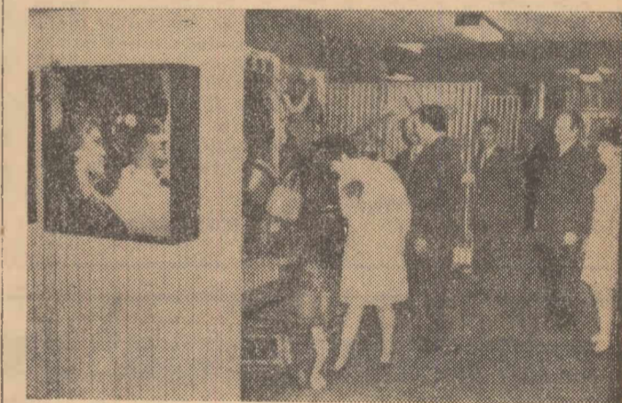
La actuala ediție a Tîrgului internațional de la Milano, deschis în mod oficial marți și la care sînt reprezentate firme, societăți și organizații comerciale din 65 de țări ale lumii, România participă cu un pavilion prezentînd produse ale industriei constructoare de mașini și mașini-unelte, chimice și petrochimice etc., precum și un birou comercial. Fotografia înfățișează o imagine de la unul din standurile românești

M. BERAM corespondent „României libere” (Continuare în pag. a 2-a)