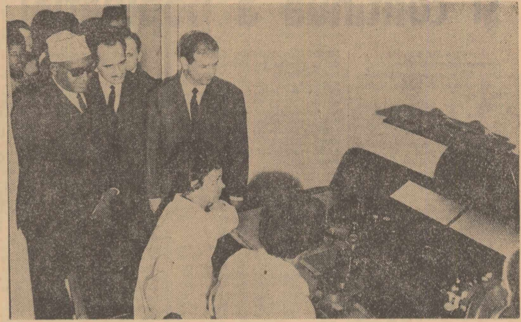
În vizită la Studioul cinematografic Buftea