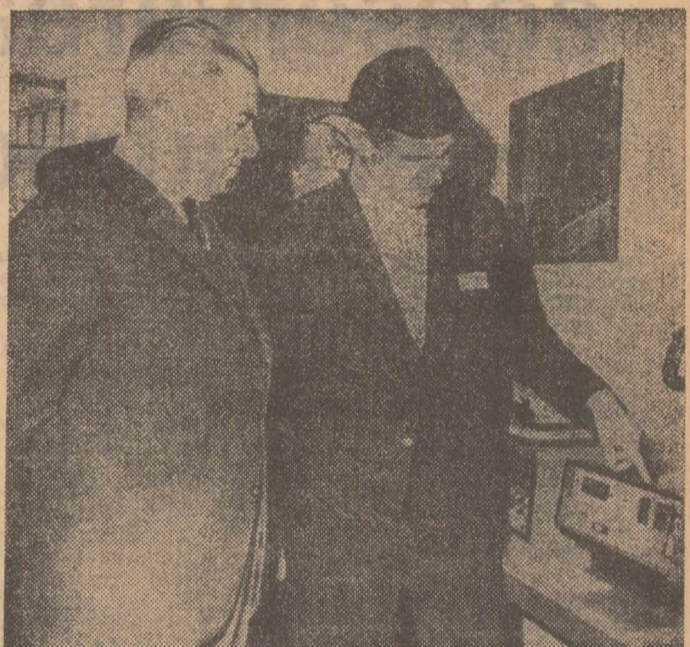
În timpul vizitei la uzina de cabluri „Nokia” din Helsinki.