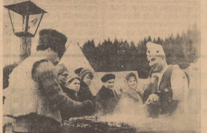
La Șura Dacilor, mirosul ademenitor al mititeilor rumeni îi îmbie pe mulți la popas...

Părerile diferite exprimate, s-au referit la esența și caracteristicile relațiilor dintre părinți și copii. Se naște însă o problemă, mult discutată de alții: cum, prin ce mijloace reușește un părinte să contribuie, alături de școală, la modelarea personalității copilului? Dar despre acestea, într-un număr viitor.