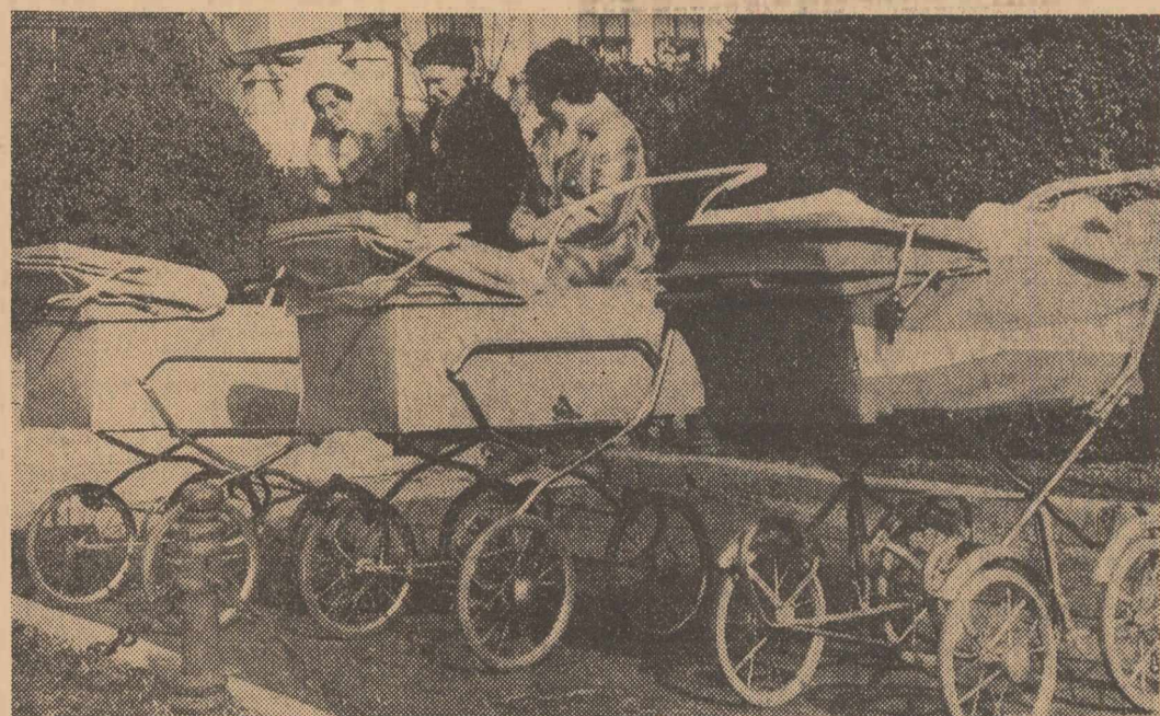
Ieri, în Cișmigiu

NICOLAE CEAUȘESCU Președintele Consiliului de Stat al Republicii Socialiste România