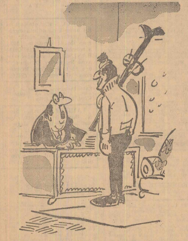
— Te-ar deranja foarte rău tov. Popescu dacă te-am trimite 3-4 zile, în interes de serviciu, la Predeal?