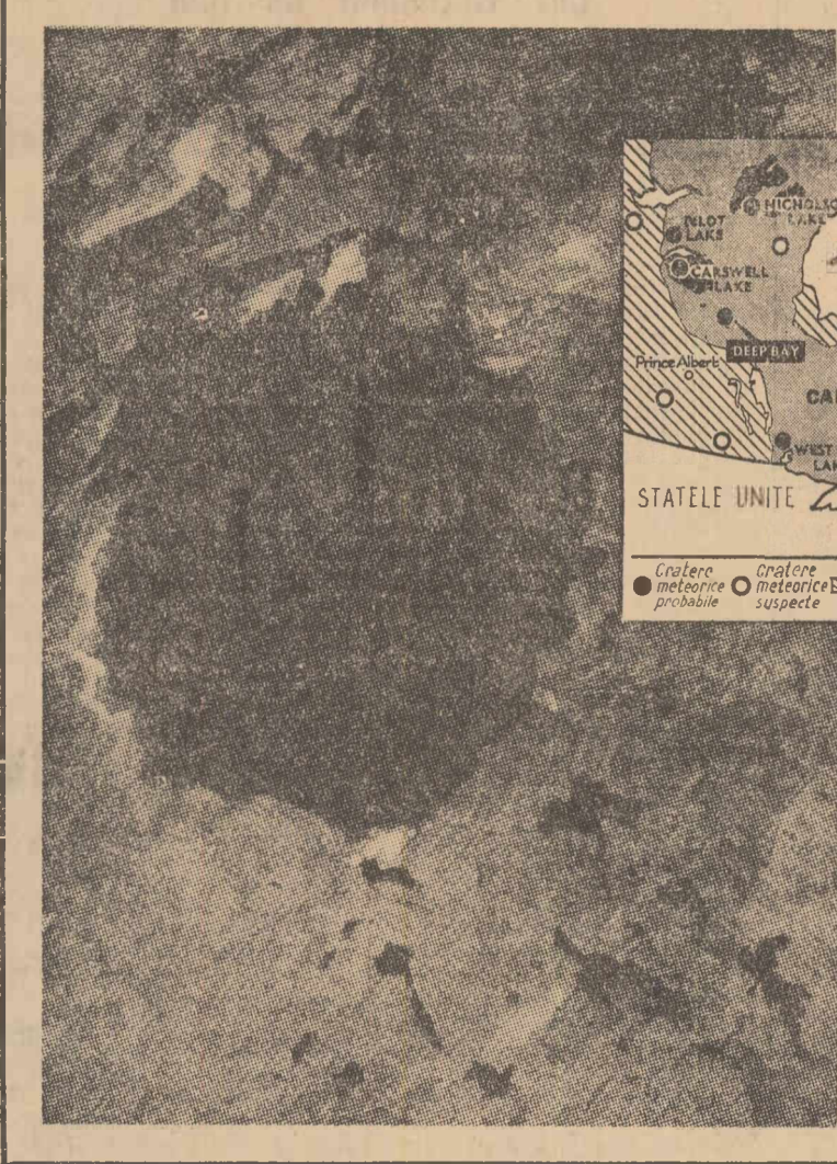
Ici și colo, pe suprafața Pământului se mai află grupuri de roci care, deși au suportat intemperii sute de milioane de ani, au rămas intacte. Unul dintre acestea este și „scutul” canadian, cuprins între Oceanul Atlantic și zona muntoasă.

În ultimii ani au fost descoperite în aceste locuri o mulțime de cratere, asemănătoare celor care au fost fotografiate pe Lună, care se crede că sînt provocate de meteoriți sau comete. Tipic este Deep Bay (Golful adînc) care se vede în fotografia noastră. Are, într-adevăr, forma unui golf, cu un diametru de 6 mile (aproape 10 kilometri) și face parte din Lacul Reindeer, lung de 150 mile. În timp ce restul lacului este puțin adînc, Deep Bay are o adîncime de peste 200 de metri! Unele cercetări recente au stabilit că adîncimea inițială a acestui golf ar fi fost de aproape 1 000 de metri!