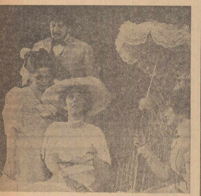
Scenă din piesa „Livada cu vișini”