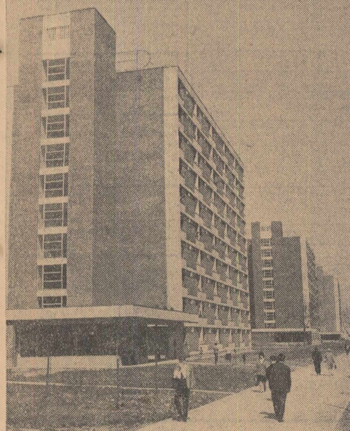
În anii noștri, construcția de locuințe a luat, la Hunedoara, o amploare deosebită. Cliseul nostru vă prezintă o imagine din noua înfățișare urbanistică a Hunedoarei.