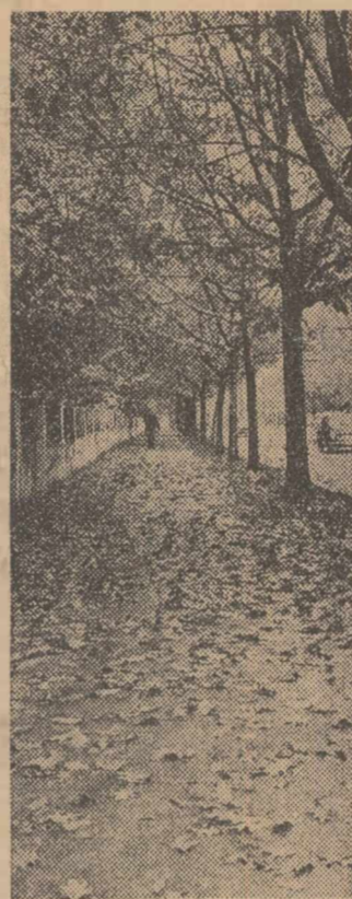
Zi de toamnă

Noile capacități, care urmează să intre în funcțiune la sfîrșitul anului viitor, vor asigura o creștere cu 50 la sută a producției actuale de fire relon și dublarea celei de rejele-cord. Aceasta va contri-