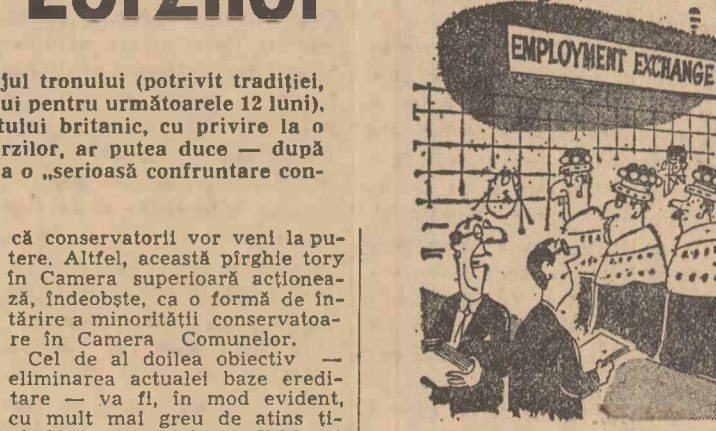
Funcționarul: — În aceste zile avem aici o clasă superioară de clienți... (Desen din ziarul laburist „Sun”)

După inițierea legii cu privire la Camera lorzilor, la Oficiul de plasare a brațelor de muncă.