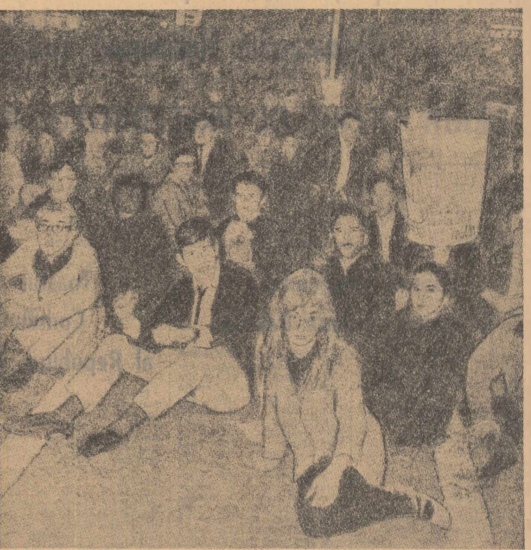
„Oxford Street a fost complet blocată”, nota în relatarea sa reportajul ziarului Daily Express...