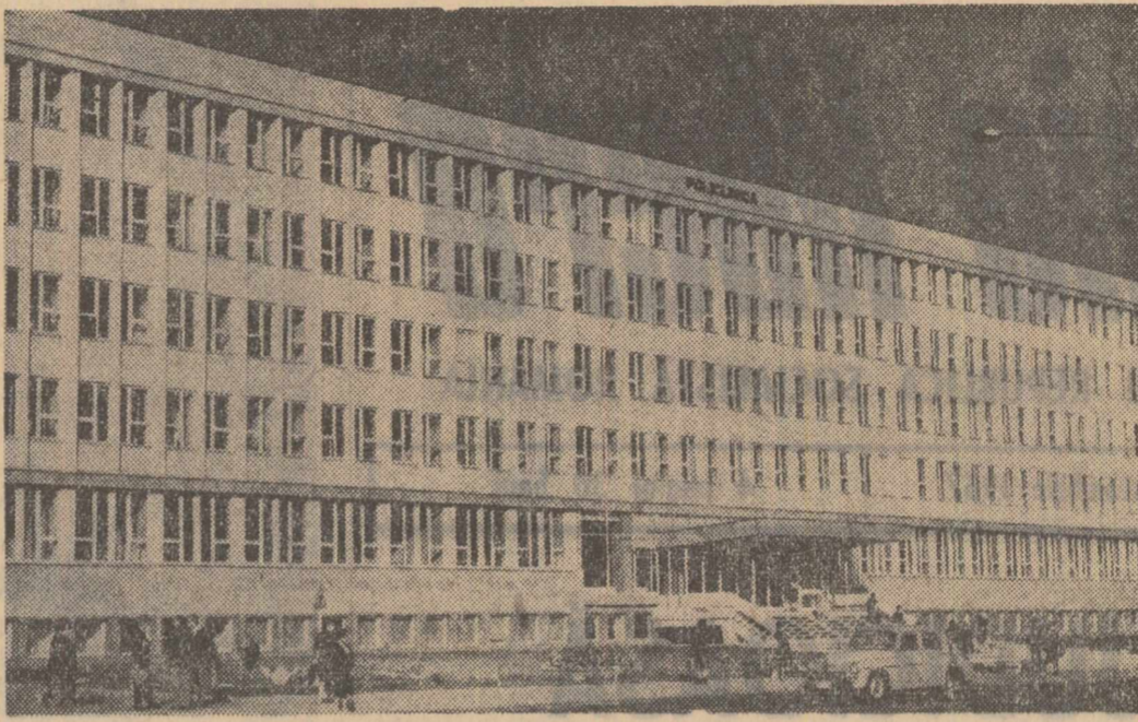
Noua polițenică din centrul orașului Iasi