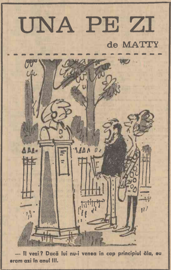
— Te vezi? Dacă lui nu-i venea în cap principiul ăla, eu eram azi în anul III.

re, cu o capacitate de 6 200 000 mc va fi umplut cu apă din riul Suceava, printr-o conductă de aducțiune în lungime de 3 km, a cărei instalare s-a terminat. Acum se lucrează intens la stația de captare a apei.