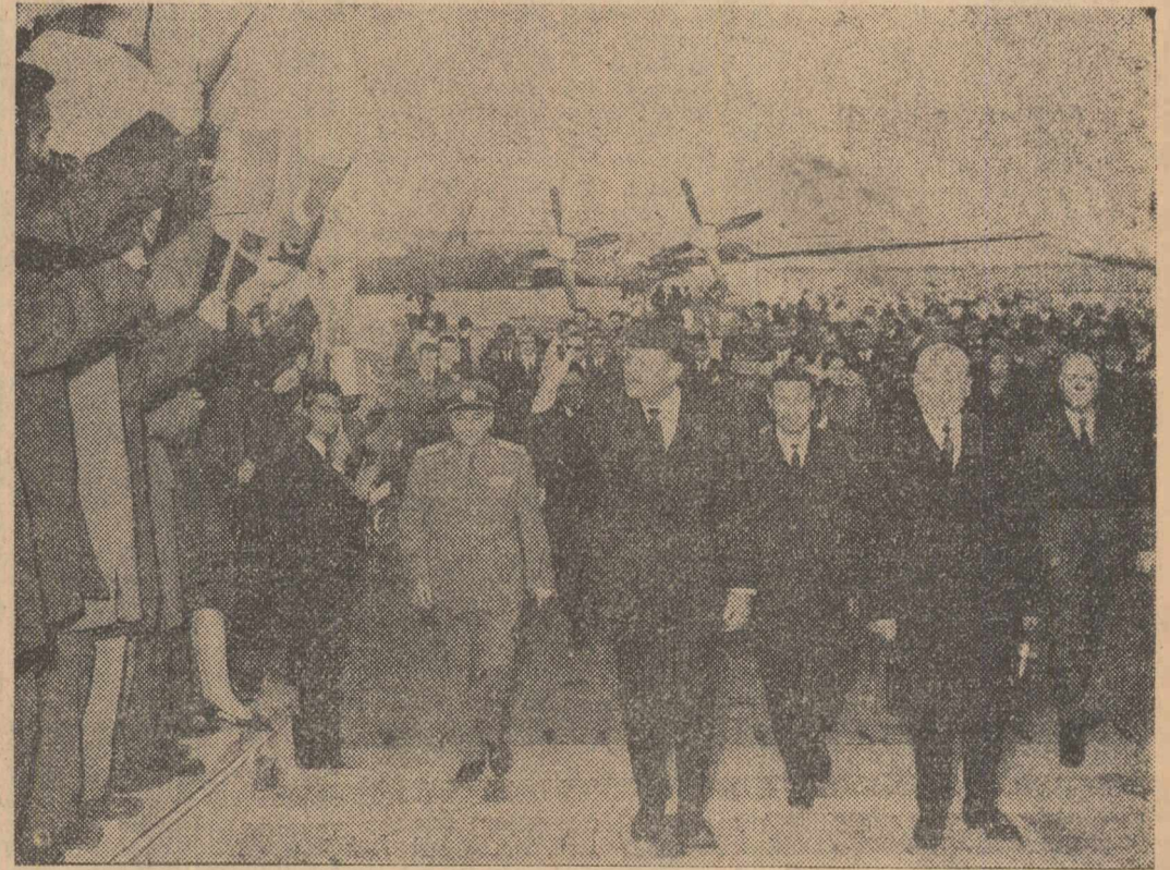
La sosire, pe aeroportul Băneasa

La invitația președintelui Consiliului de Stat al Republicii Socialiste România, Chivu Stoica, vineri după-amiază a sosit la București într-o vizită oficială feldmaresalul Mohammad Ayub Khan, președintele Republicii Islamice Pakistan.