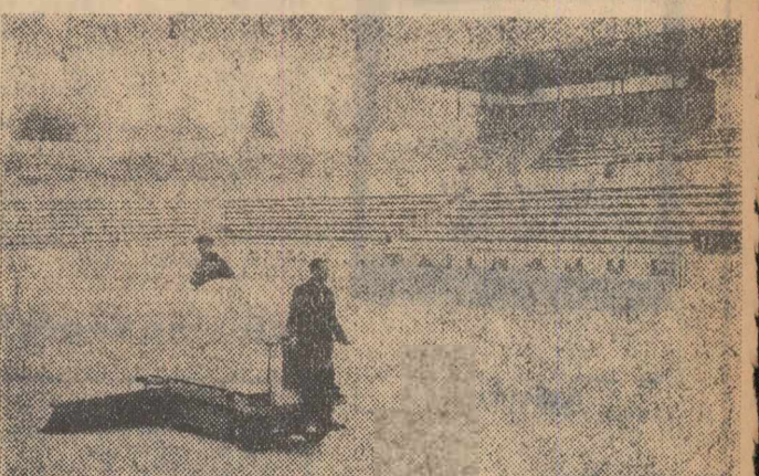
Începând de mine, iubitorii patinajului vor putea practica din nou sportul preferat pe oglinda de gheață a patinoarului din cadrul Complexului sportiv „23 August”. În clișeu: Se fac ultimele retușuri ghetei.

GRAZIELA VINTU (Continuare în pag. a 2-a)