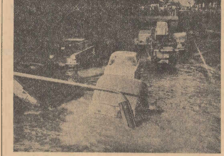
O stradă din Madrid care s-a prăbușit sub greutatea mașinilor! Acum citiva timp, pe o porțiune a străzii Almagro, de la începutul ei, în piața Alonso Martinez, și colțul cu strada Fernando el Santo, pavajul a cedat la o adîncime de trei metri, în timp ce pe el treceau simultan zece automobile. Acest neobișnuit accident s-a soldat cu doi morți și o persoană grav rănită. Totodată, au fost distruse conductele de gaze și apă.

BUENOS AIRES 11 (Agerpres). — Cel puțin 25 de persoane, dintre care 12 copii au pierit în ultimele 24 de ore în urma puternicelor inundații din regiunea Buenos Aires considerate ca cele mai importante din ultimii 50 de ani. Fiole terribile care s-au abătut începînd de duminică asupra capitalei argentine și împrejurimilor sale au provocat pagube materiale considerabile. Activitatea în uzine, centralele electrice, precum și comunicațiile aeriene și terestre au fost paralizate. Detasamente ale poliției și armatei au fost mobilizate pentru a ajuta la evacuarea familiilor ale căror case au fost acoperite de apă. Autoritățile federale și din provincie lansează prin radio apeluri către populație să vină în ajutorul sinistratilor colectînd îmbrăcăminte, alimente și medicamente. Pericolul unor noi inundații continuă să planeze asupra zonelor afectate. Apele fluviului Rio de la Plata, au apărut în unele locuri înfigute, inundînd cartierele de la marginea capitalei argentine.