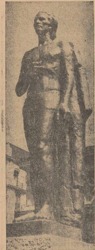
În parcul din fața Ateneului Român și-a aflat de curind locul nimerit sculptura monumentală a lui Eminescu de Gh. Anghel.

CRAIOVA (coresp. R.I.) Oricât de minuoasă și cuprinzătoare, o monografie a orașului Calafat n-ar fi putut consemna, până acum vreo activitate economică mai deosebită. Existau doar ateliere meșteșugărești și alte unități mărunte, de însemnătate strict locală. Astăzi, Calafatul iese din anonimat. Lucrătorii întreprinderii de construcții și amenajări piscicole au început aici lucrările pentru construirea unei fabrici de conserve. Prevăzută pentru prima etapă cu o producție anuală de 2100 tone, noua întreprindere va intra în funcțiune în anul 1969. Ea va prelucra materia primă furnizată de cooperativele agricole situate în apropierea orașului.