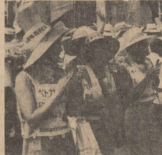
În întreaga Japonie continuă să se desfășoare numeroase manifestări pentru pace, împotriva bazelor militare străine amplasate pe teritoriul japonez și a intrării navelor militare americane cu propulsie nucleară în porturile acestei țări, pentru încetarea intervenției Statelor Unite în Vietnam și restabilirea păcii în sud-estul asiatic. La aceste manifestări participă mii de cetățeni japonezi. Fotografia redă un aspect de la una din aceste manifestări, care a avut loc recent la Tokio.

In pagina IV-a • Lucrările celei de a XXII-a sesiuni a Adunării Generale • Succes prin „neprezentare” — Corespondența din Londra de la Bob Leeson — • „Neant îmbrăcat în monedă” — Un articol al economistului francez Rueff despre reforma sistemului monetar interoccidental —