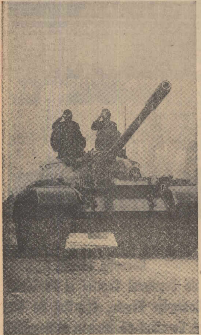
Pieptul de oțel al patriei socialiste!

prim prînfunda adeziune față de politica activă de pace pe care România socialistă o desfășoară pe plan internațional. Iar pacea, acest bîm de neprețuit al întregii omeniri, înseamnă în primul rînd, folosirea cucceririlor științei în scopuri pașnice, nediseminarea armelor atomice, lichidarea lor. Expresia profundului atașament față de politica externă a țării noastre a fost enunțată în formele la demon-