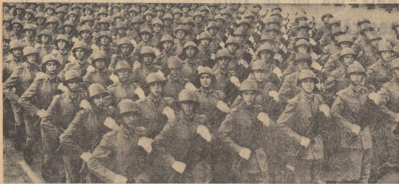
Trec bravii ostași ai țării