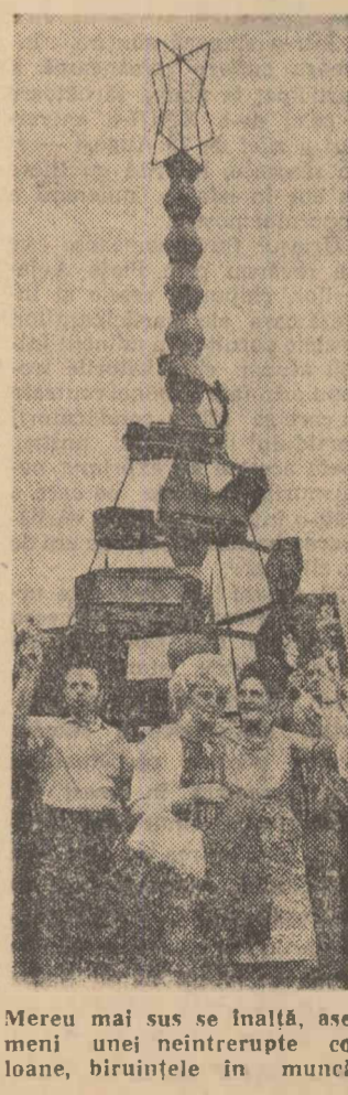
Mereu mai sus se înalță, asemeni unei neîntrerupte coloane, biruințele în muncă.