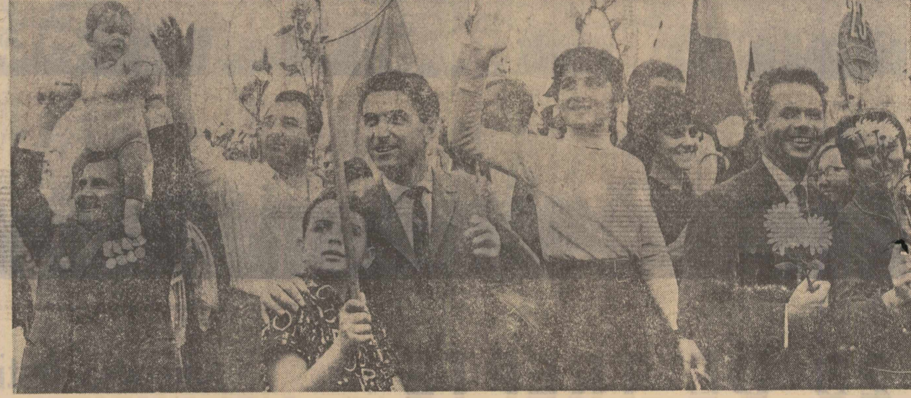
Cu neajmurnită bucurie, cu încredere în inimi

Invlînd în fața ochilor noștri acel trecut de lumină, veterani din august 1944 priveau spre batalioanele alinate în Piața Aviatorilor pentru parada în cinstea marii sărbători. Cum vă pregătiți voi estăzi să apărați gila străbună? — păreau să se adreseze ei tinerilor ostași. La această întrebare, nerostită dar mereu vie în conștiința lor, militarii aflați sub stindard răspund