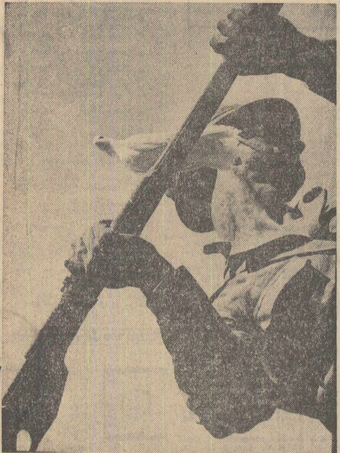
Semicentenarul eroicelor lupte de la Mărăști, Mărășești și Oituz