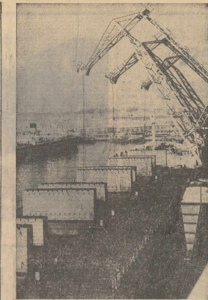
Zilele trecute s-a întors în portul Constanța, venind de la Annaba (Algeria) mineralierul „Hunedoara”. În clișeu: Un aspect din timpul descărcării minereului de fier

În inima Iașilor, unde îndrăzneala ar fi trebuit să dea amploare vestitei Pieși a Unirii deschizîndu-i laterale și sprîlîndu-i spațiul vast pe monumente, arhitectul proiectat a dovedit totală neaderență la tradițiile de cultură ale Iașilor. Piața Unirii așa cum arată azi