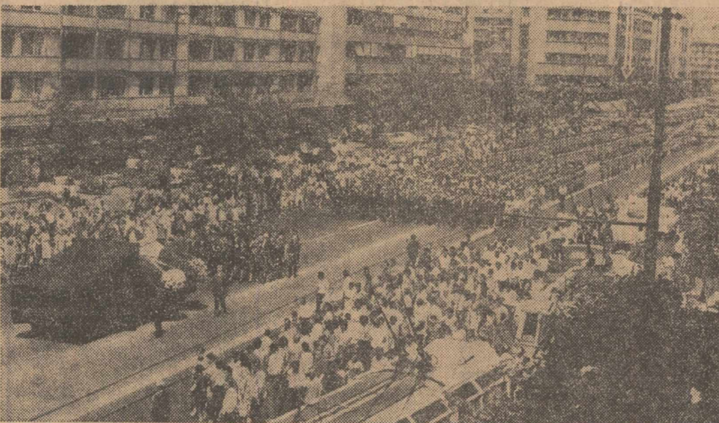
De-a lungul străzilor orașului, mii de bucureșteni iau parte cu durere la clipa despărțirii de marele poet Tudor Arghezi.