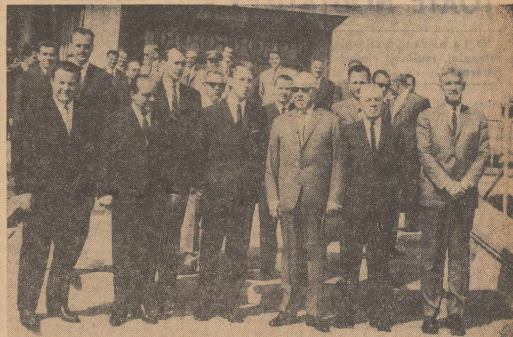
La plecare, pe aeroportul Băneasa

Președintele Consiliului de Miniștri al Republicii Socialiste România, Ion Gheorghe Maurer, a părăsit luni dimineața Capitala, plecînd cu avionul spre Haga, unde va face o vizită oficială la invitația guvernului olandez.