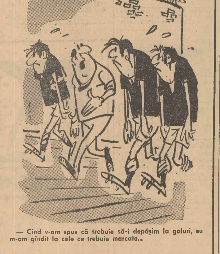
— Cînd v-am spus că trebuie să-i depășim la goluri, eu am gîndit la cele ce trebuie marcate...

FLOREA CEAUȘESCU (Continuare în pag. a 3-a)