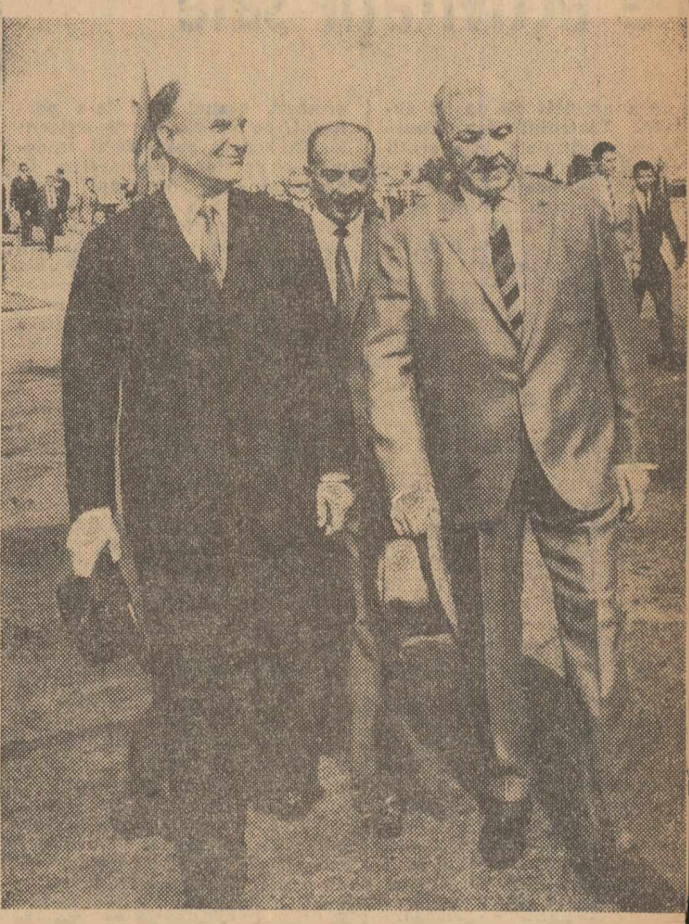
Pe aeroportul Băneasa, înainte de plecare

Pe aeroport erau arborate drapelurile de stat ale României și Austriei. După intonarea imnurilor de stat ale celor două țări, cancelarul federal al Republicii Austria și președintele Consiliului de Miniștri al Republicii Socialiste România au trecut în revistă garda militară de onoare aliată pe aeroport. Apoi, oas-