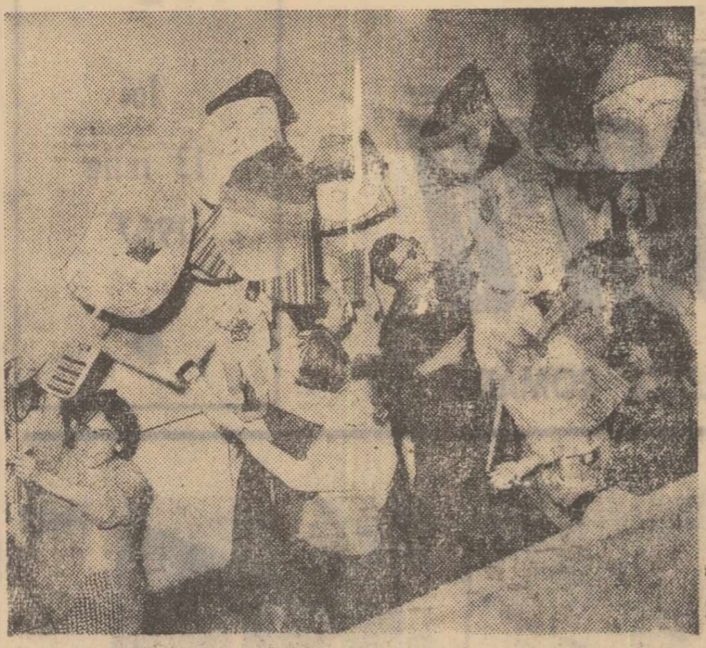
În prezent colectivul Teatrului de păpuși din Craiova lucrează la pregătirea premierii cu piesa „Harap Alb” de Nela Stroescu...