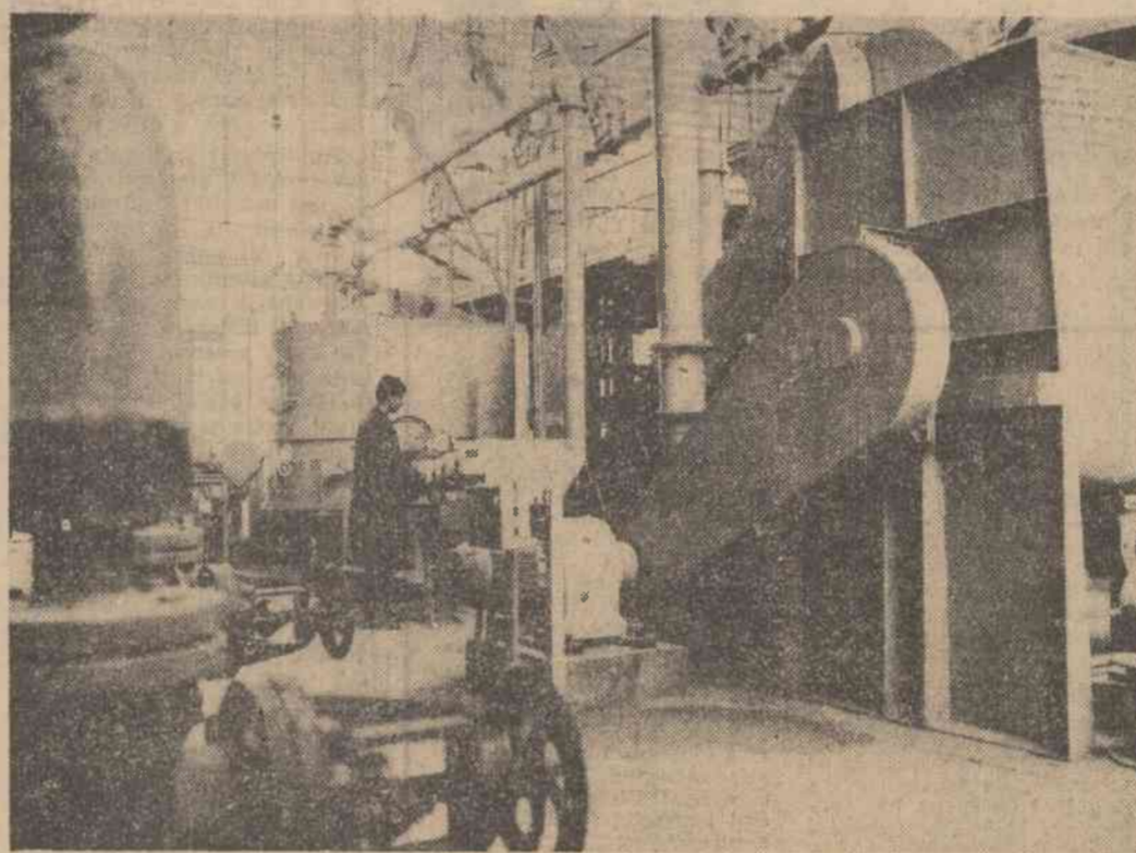
Recent, fabrica de ciment din Medgidia și-a mărit capacitatea de producție cu o nouă unitate — secția de azbociment — care este proiectată în țară și utilată cu mașini și agregate românești și străine. Procesele de producție sînt în întregime mecanizate. Intrată în funcțiune cu 2 luni de zile înainte de termen, noua secție va furniza anual 1 700 km tuburi de azbociment. Producția realizată va fi folosită la amenajarea rețelelor de irigație ce se realizează în Dobrogea și în alte regiuni din țară. În clișeu: un aspect din secția de preparare