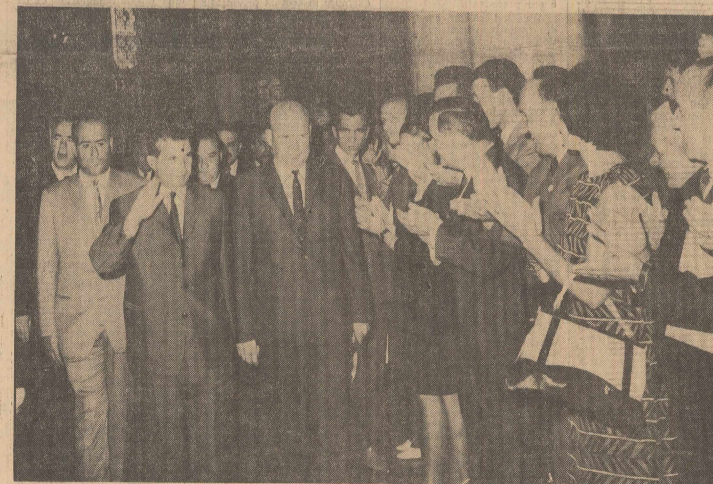
Sosirea conducătorilor de partid și de stat la consfățuire