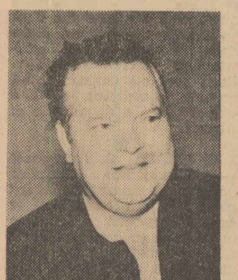
Orson Welles la București

Există cinești care aparțin unei școli, unui curent, unei cinematografii anume.